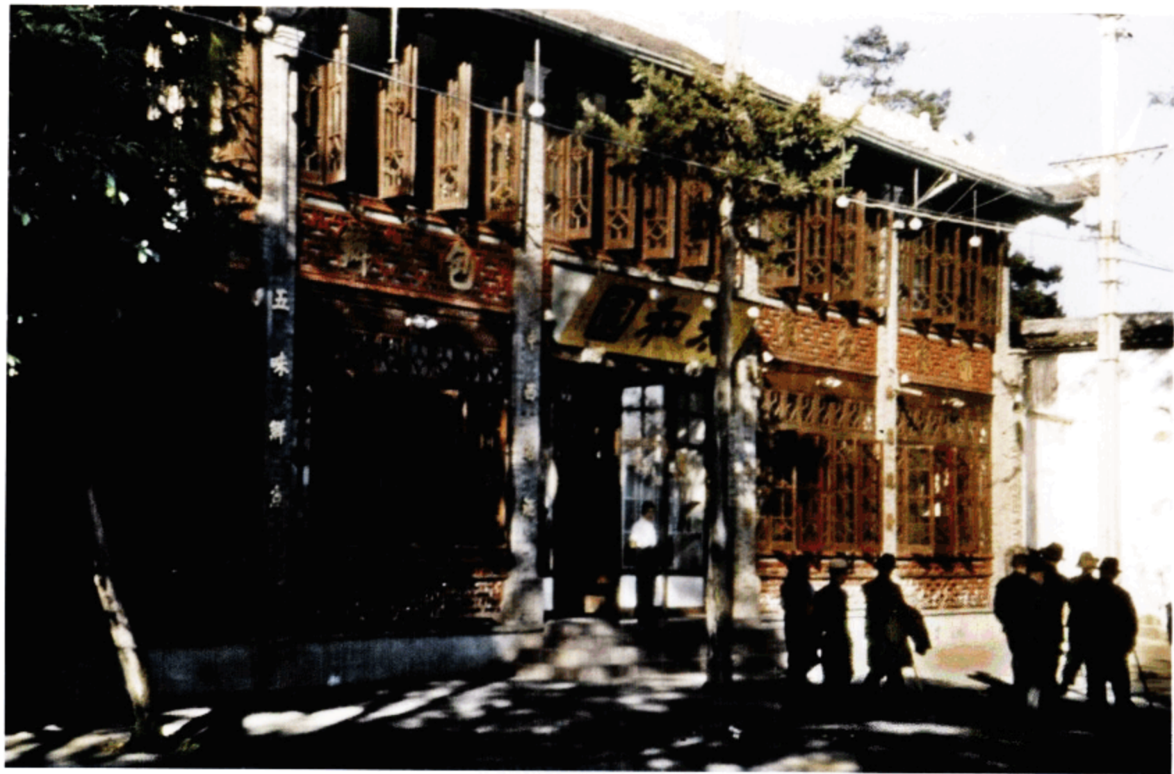
杭州“太和园”会所