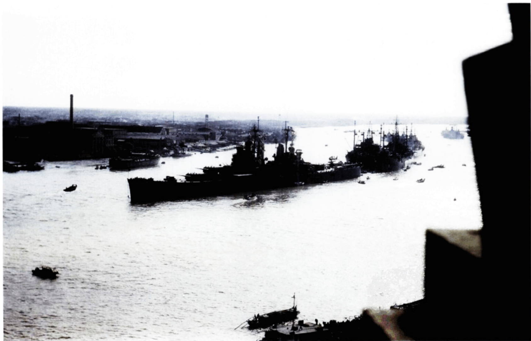
繁忙的黄浦江景象——老式帆船、驳船、商船和美国 海军舰只共用同一条水路。