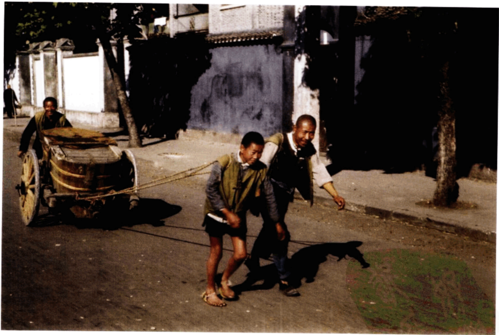
街上拉粪车的民夫