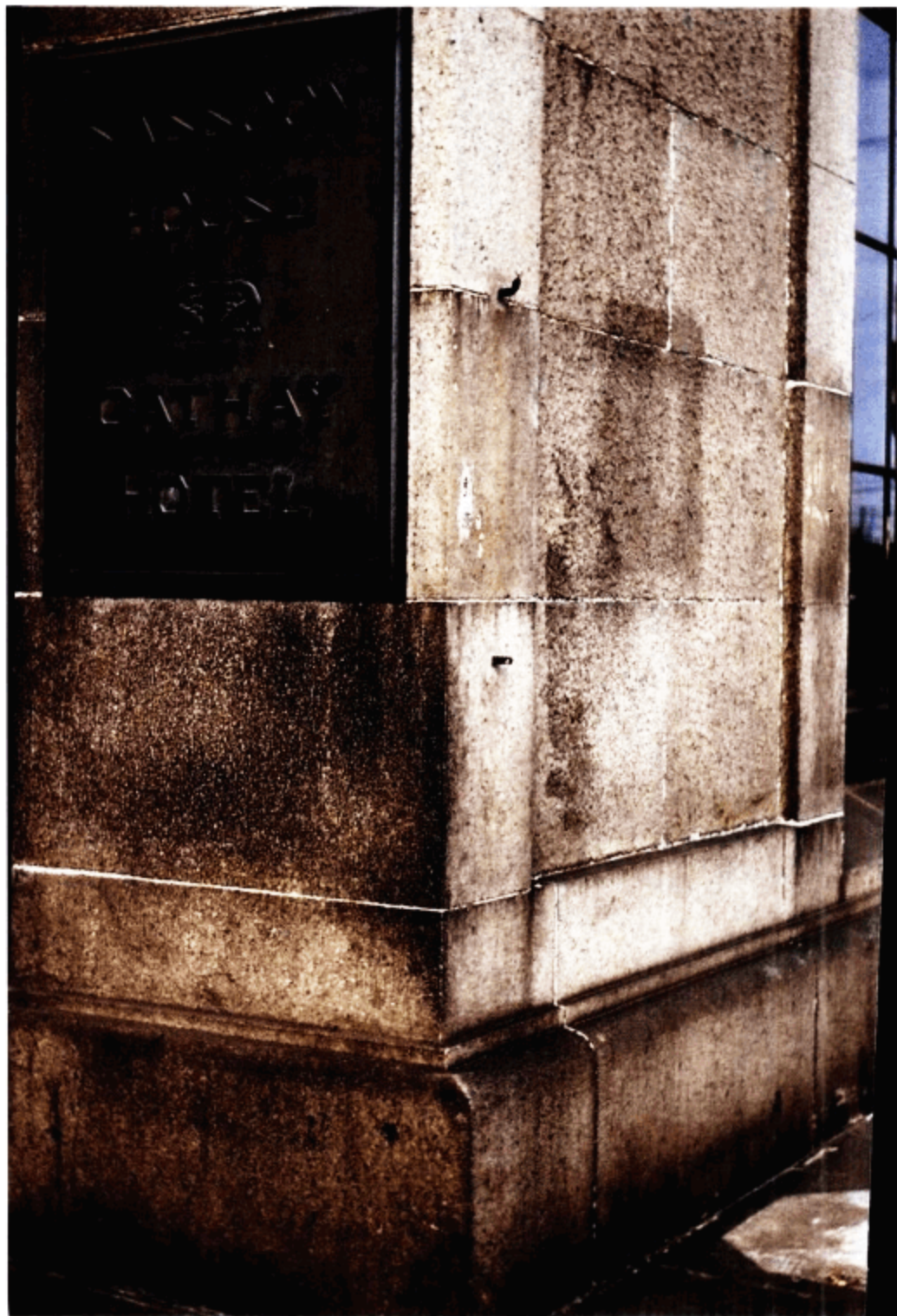
沙逊大厦华懋饭店（今和平饭店）的金属标牌。两年前故地重游，我发现这块标牌还留在饭店的墙上。