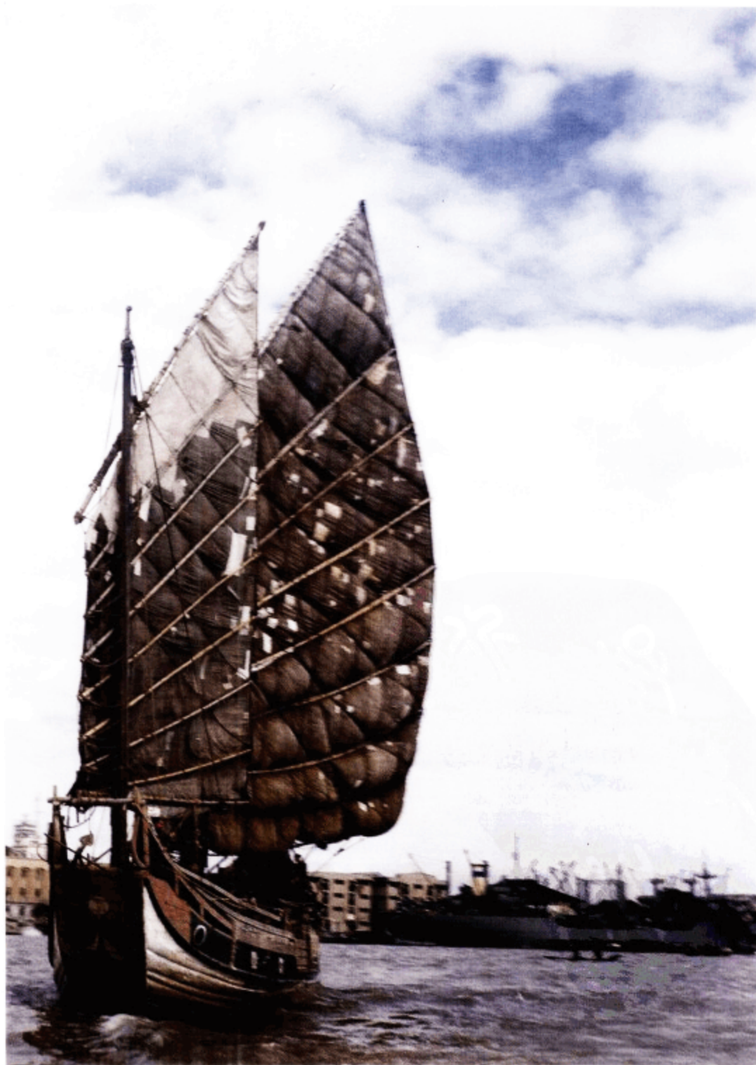
古老的帆船