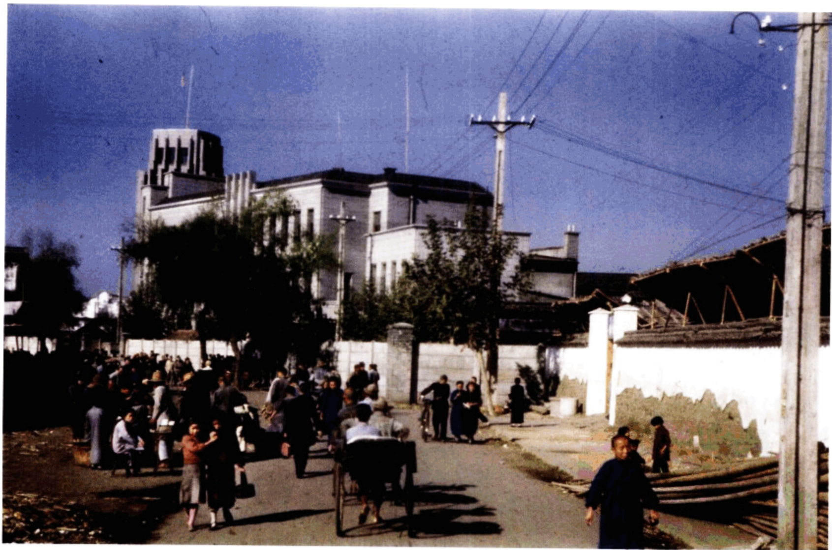
杭州街景