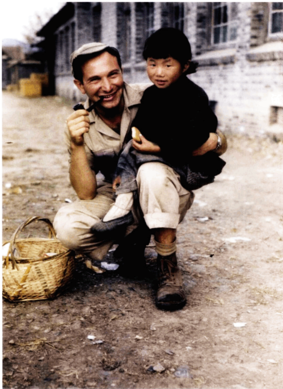
营区里美军士兵和中国女孩合影