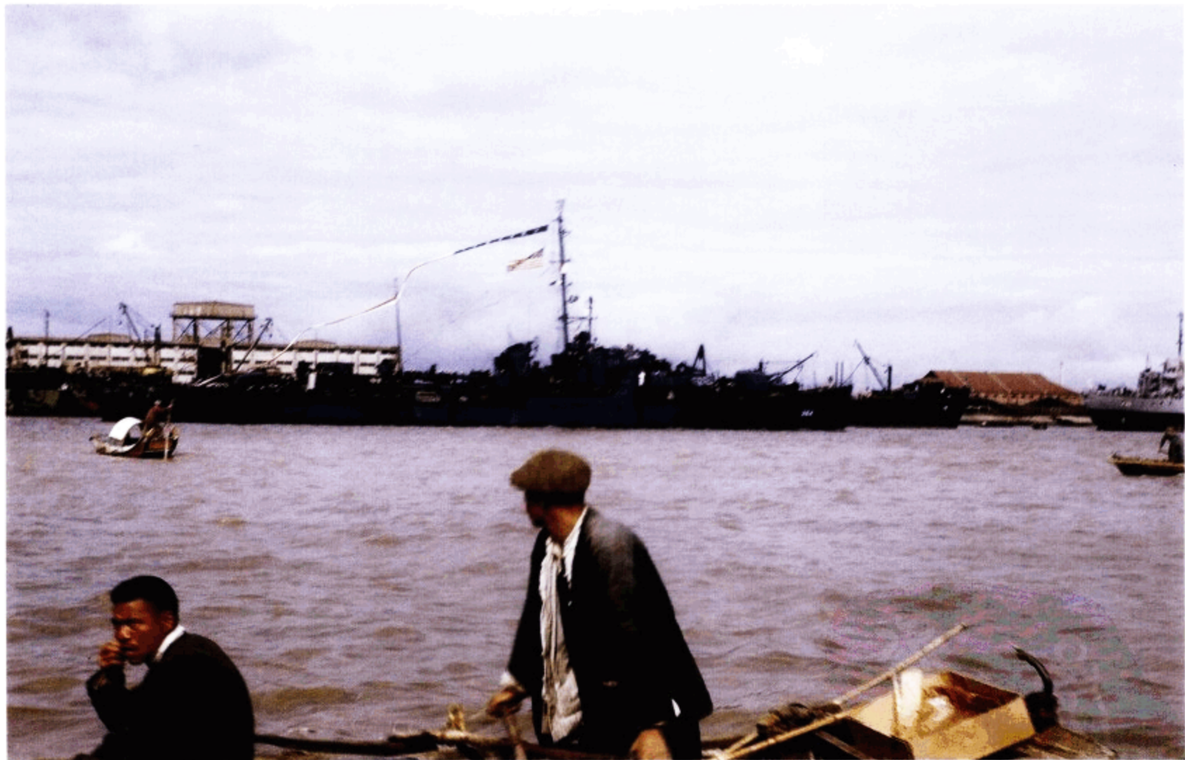
黄浦江上一直停泊着来自各国的船只，图片中停泊在江边的是令人生畏的美国太平洋舰队重型巡洋舰“圣保罗号”。