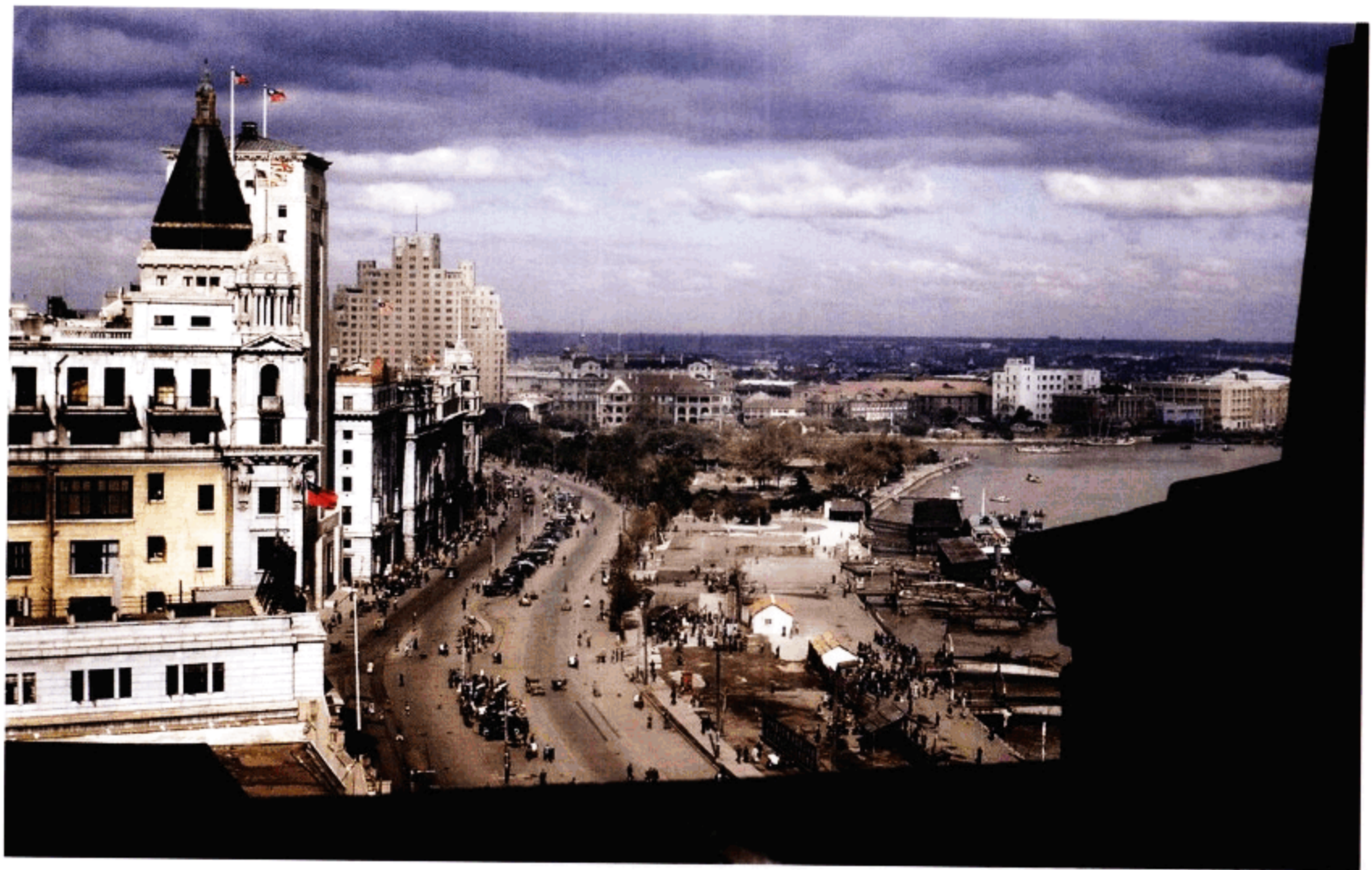
外滩。黄包车和轿车、卡车在同一条道上川流不息。