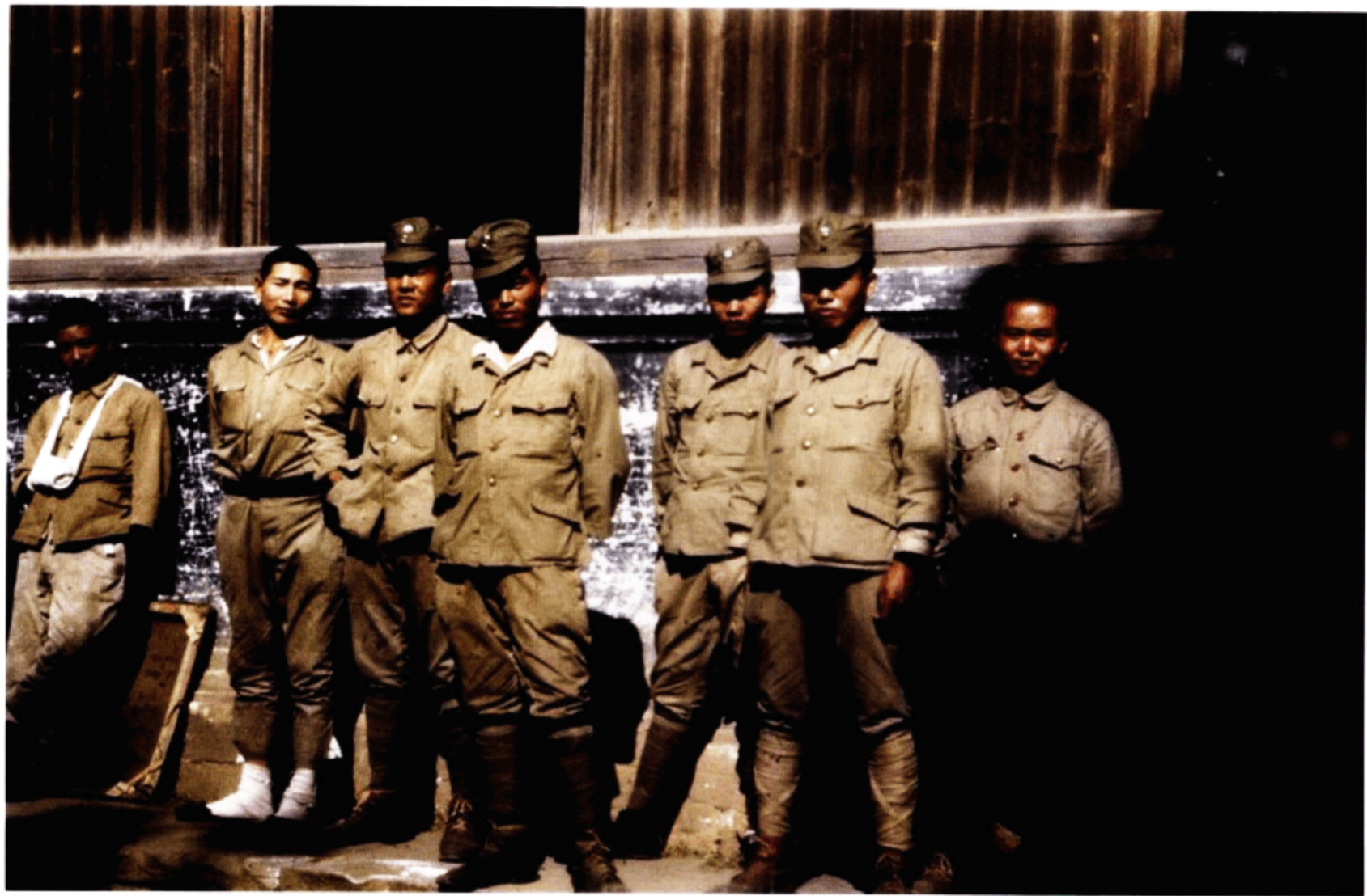
穿中国军装的日军战俘