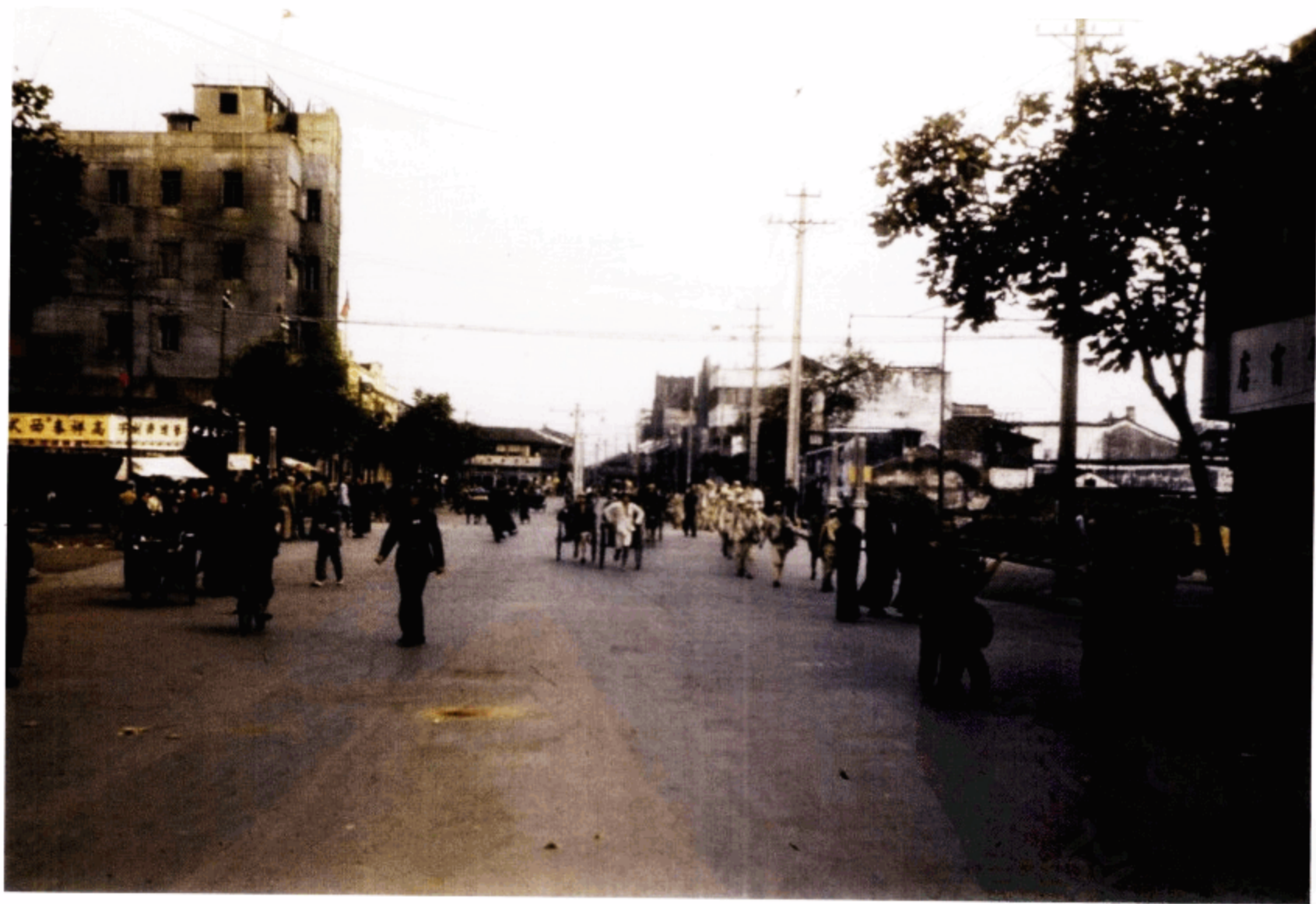
杭州街景