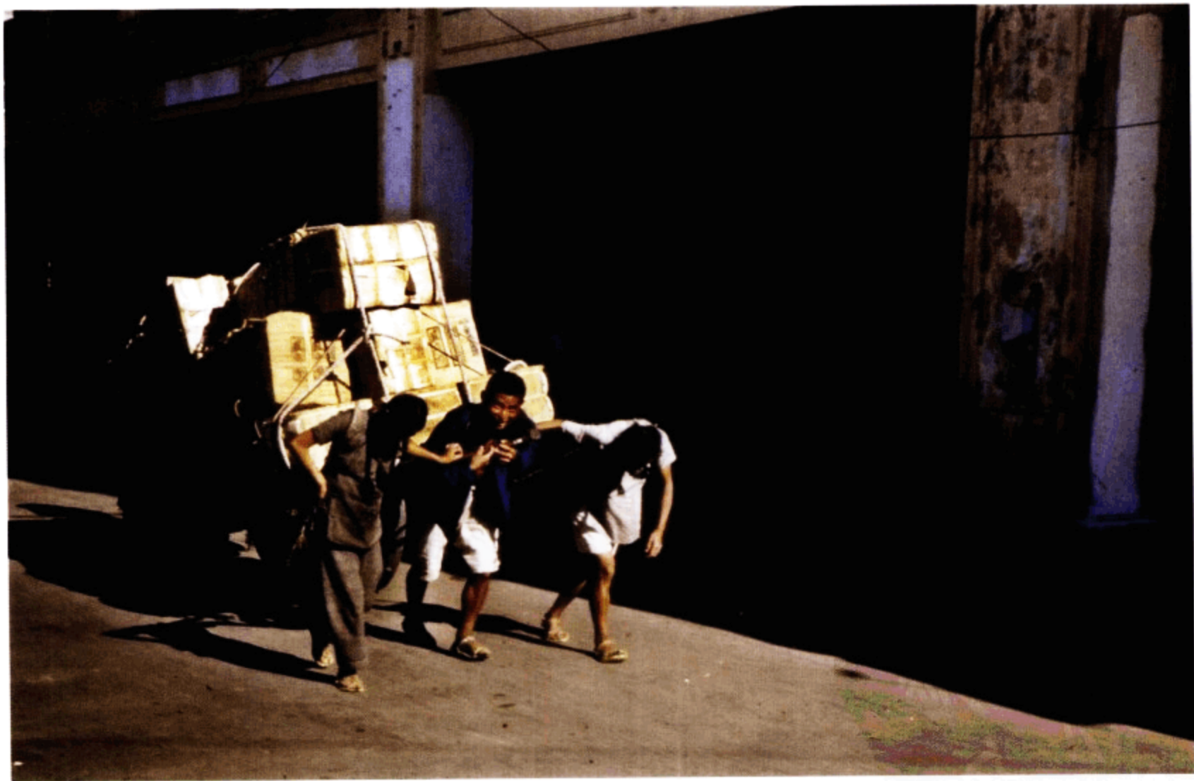
运货的民工