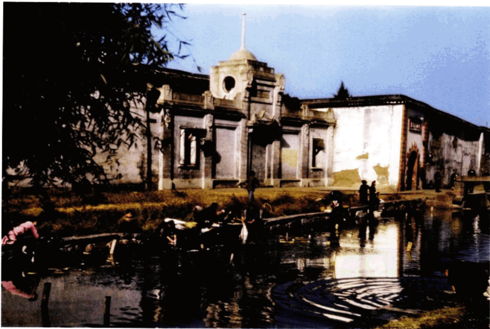
在西湖边洗衣的当地百姓