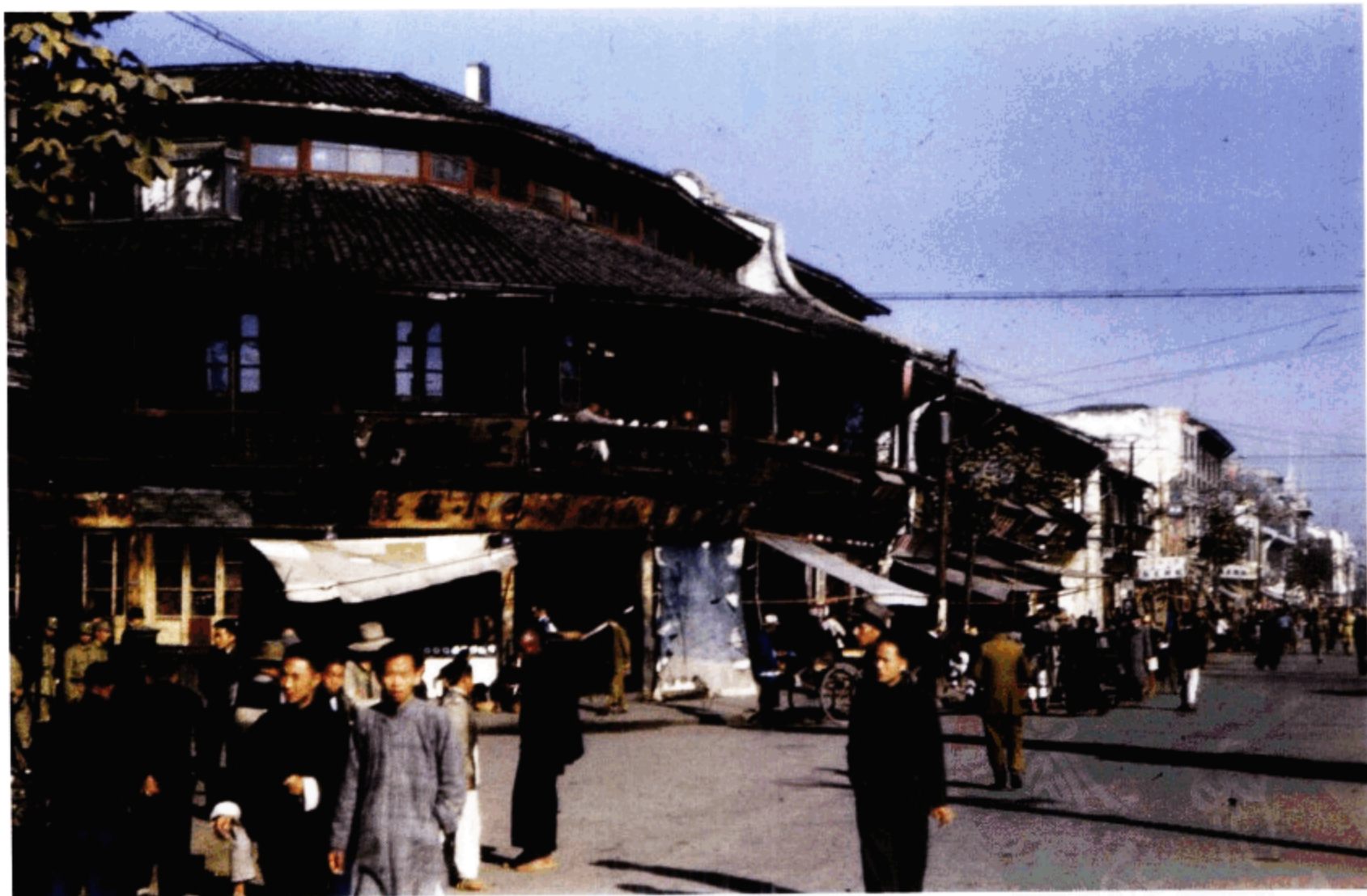
杭州街景