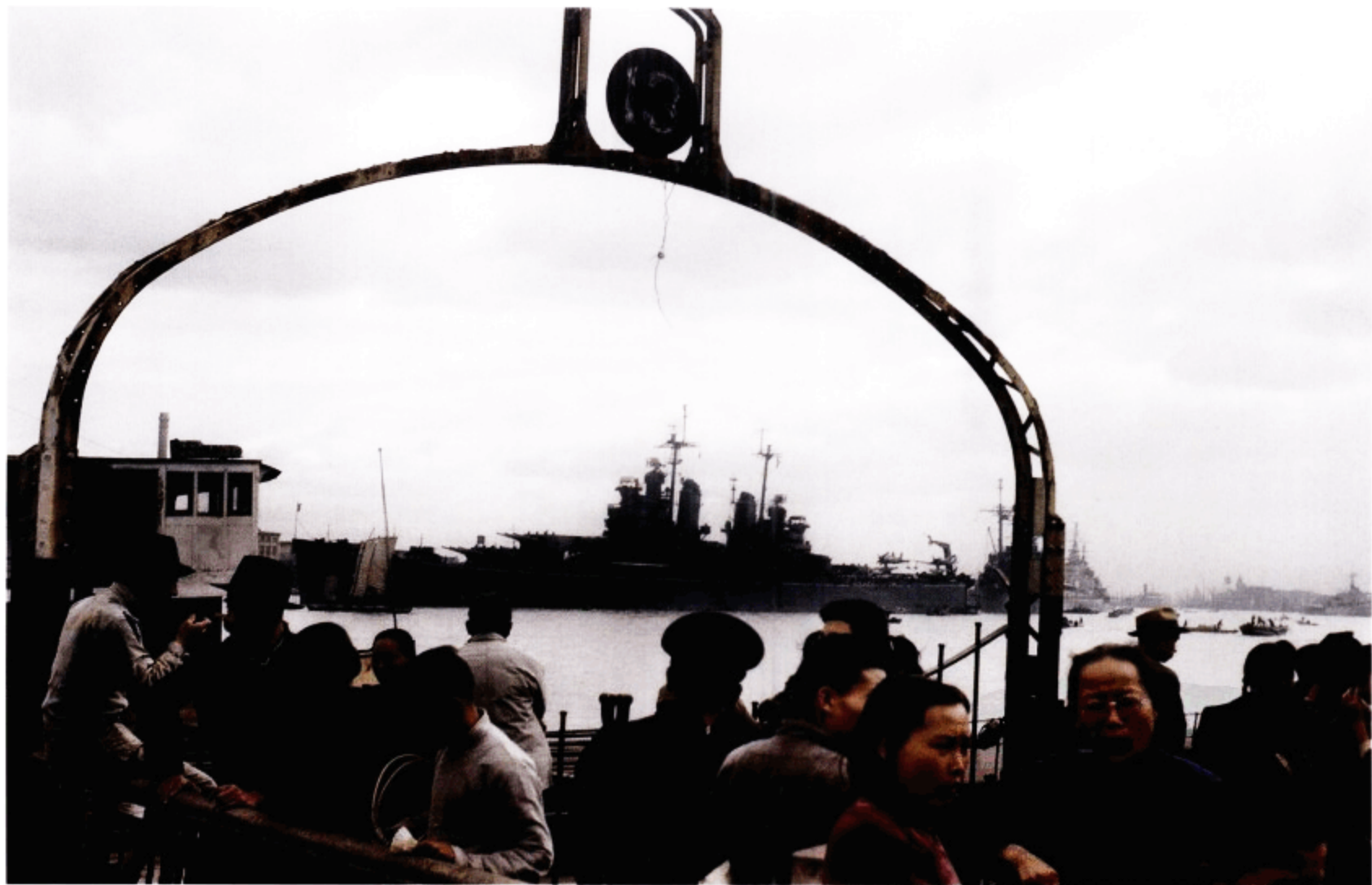
黄浦江渡口