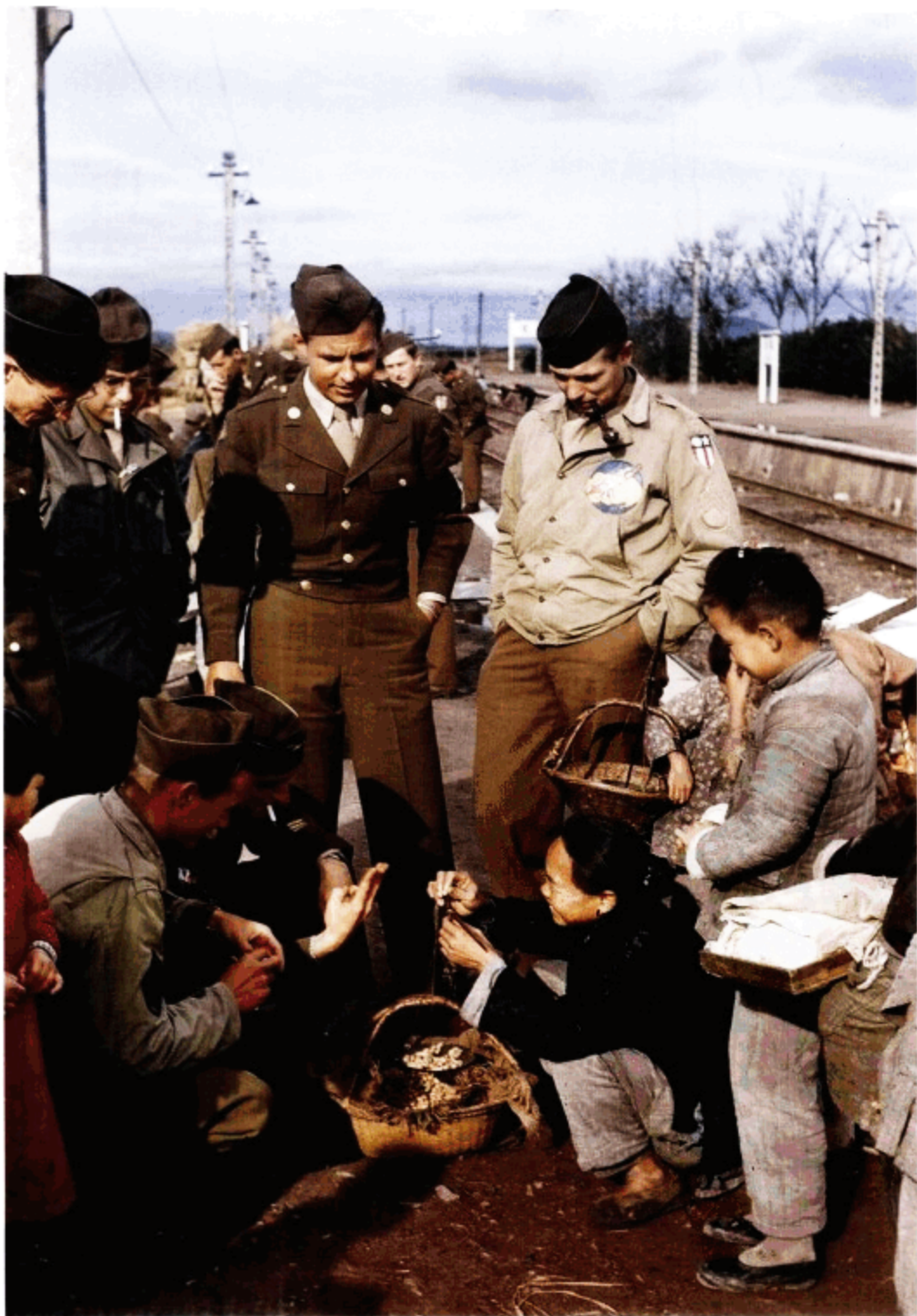
杭州火车站距离空军基地很近，1945年秋，我们有幸获得批准乘火车到几小时路程以外的上海去做一次旅行。我们饶有兴致地与站台上卖干果的妇女讲价，好买一些在路上吃。