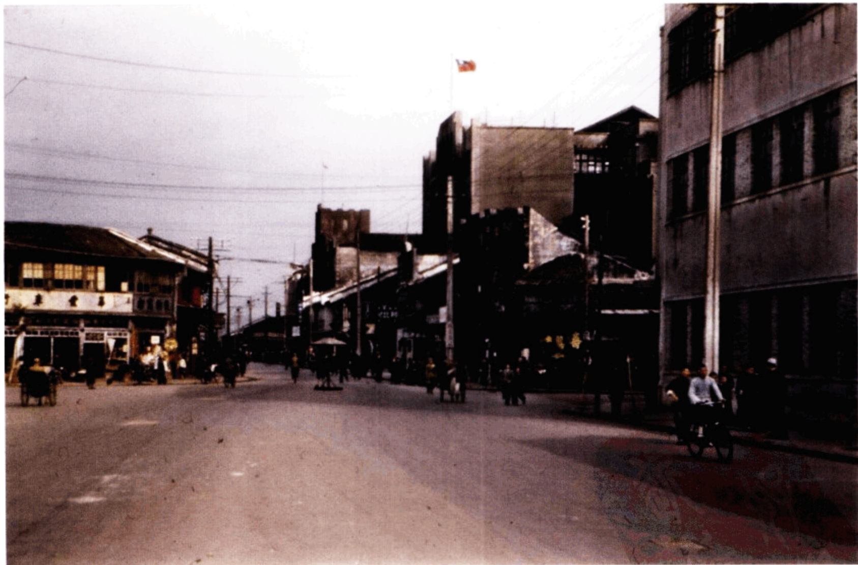
杭州街景