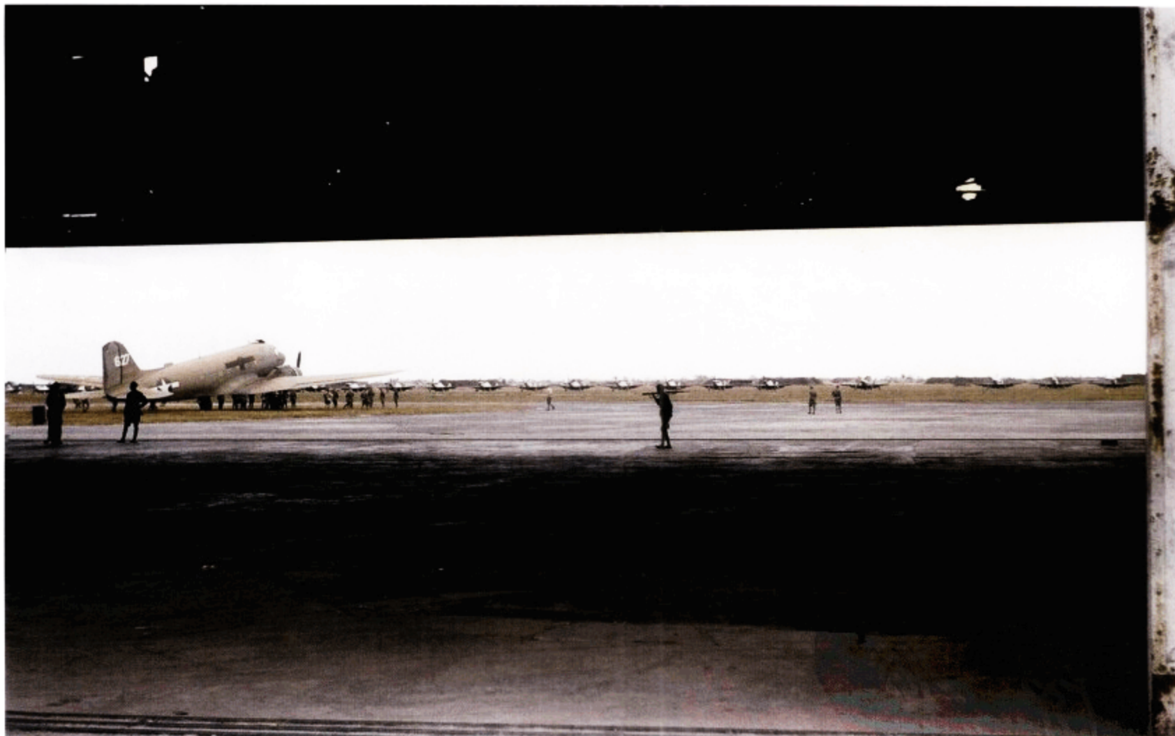
遭战争破坏的飞机修理库外停放着美军运输机和战斗机，建筑物上布满弹孔。