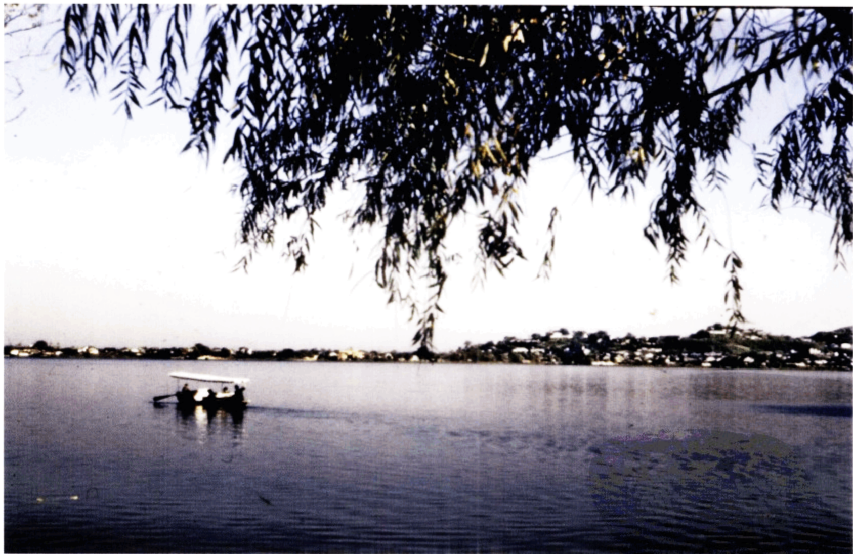
美丽的西子湖