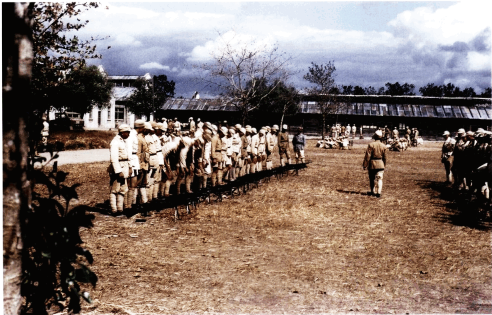
中国军队在杭州基地附近进行训练。