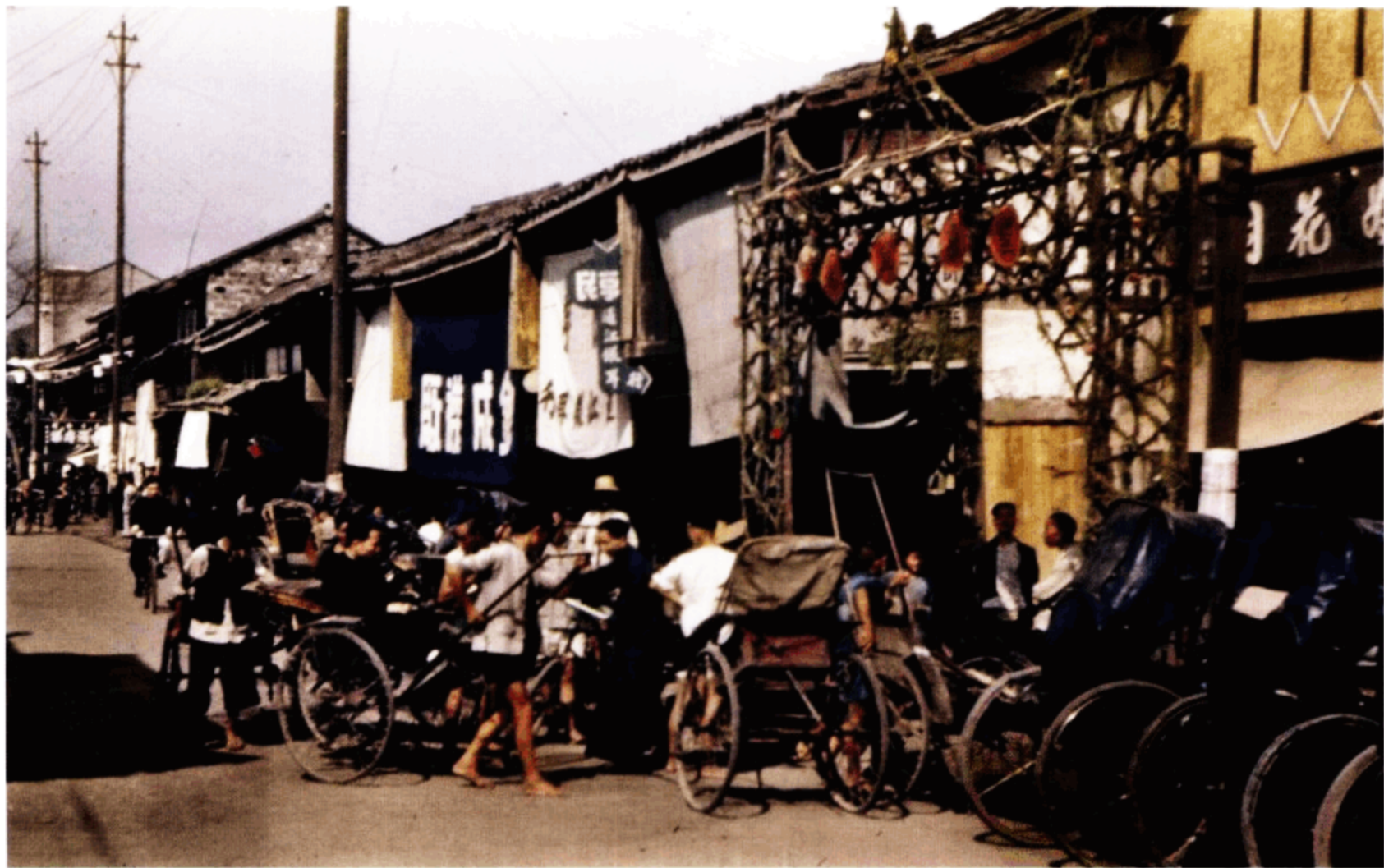
排队等客的黄包车夫们