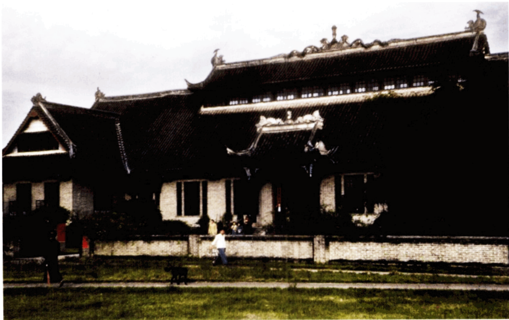
成都的图书馆