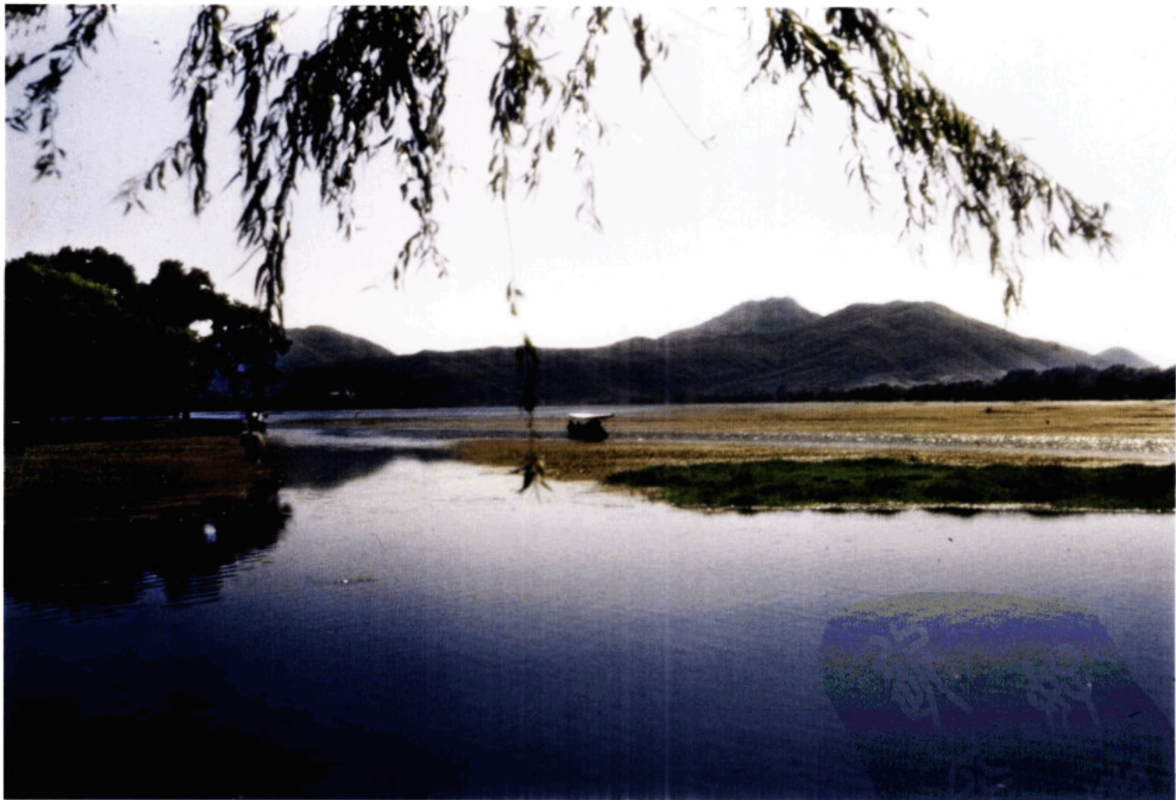
美丽的西子湖