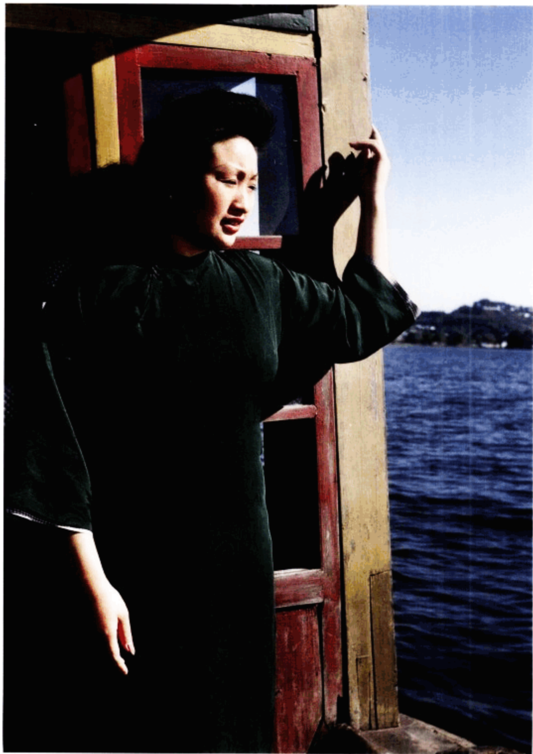
我们几个人租了一艘小船游览西湖，照片中的妇女就是我们这次快乐游览的导游。