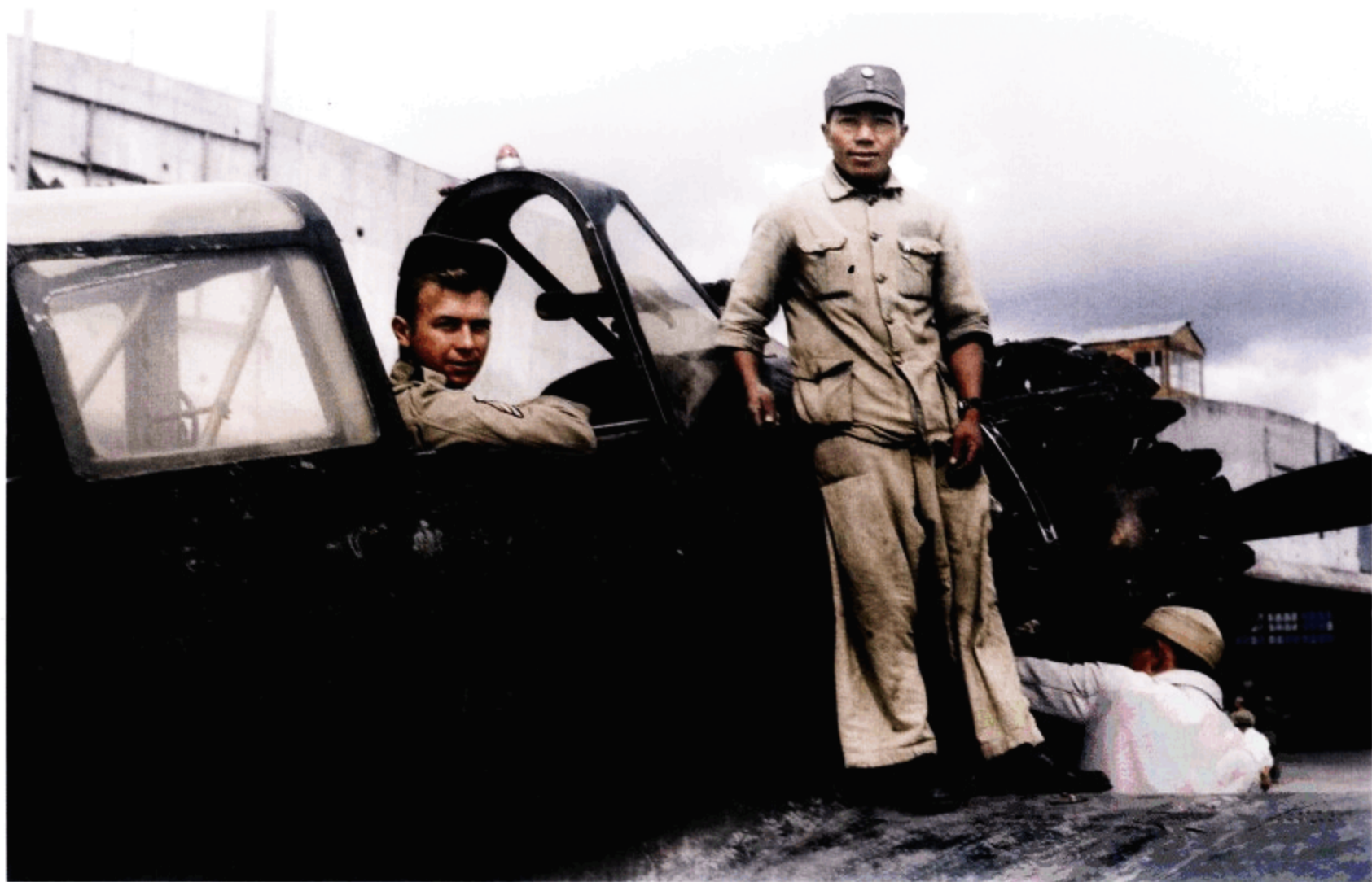
艾伦与一名中国空军技师在一架缴获后被翻新的日军战机上。