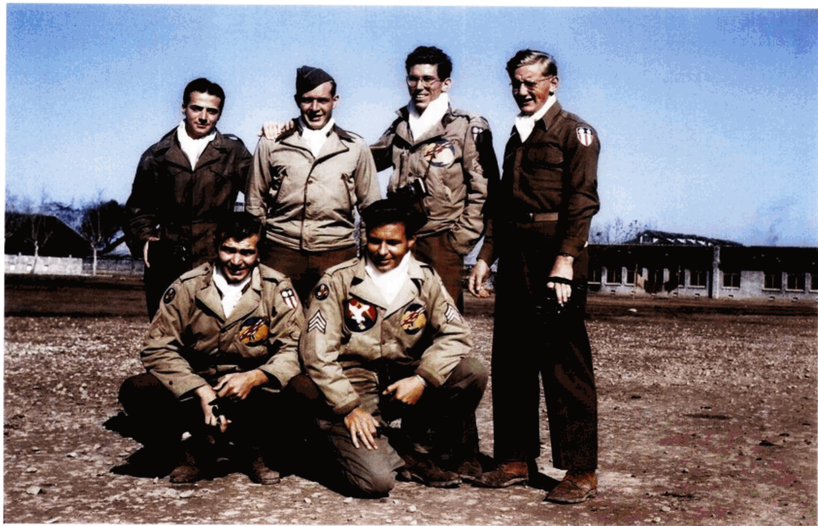
战争结束了，在中国的美国士兵欣喜地穿上干净的夹克，戴上白色的围巾，摆出姿势照相。