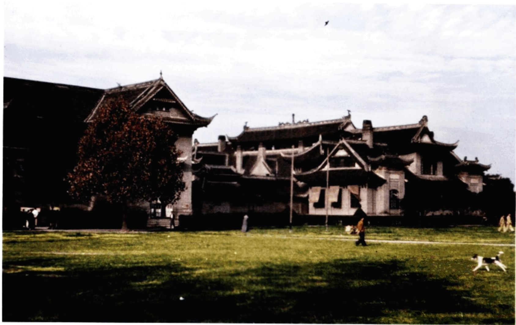
成都大学（疑为华西协和大学）