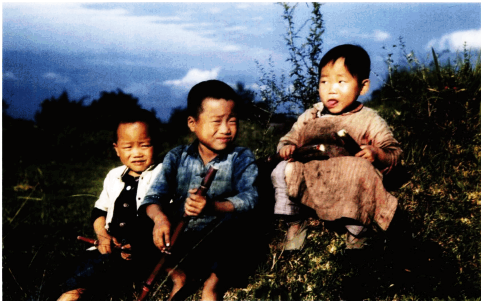
三个吃甘蔗的小男孩