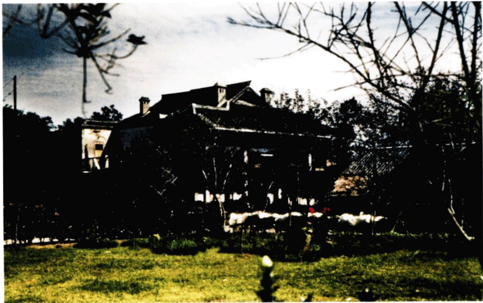
成都的医院