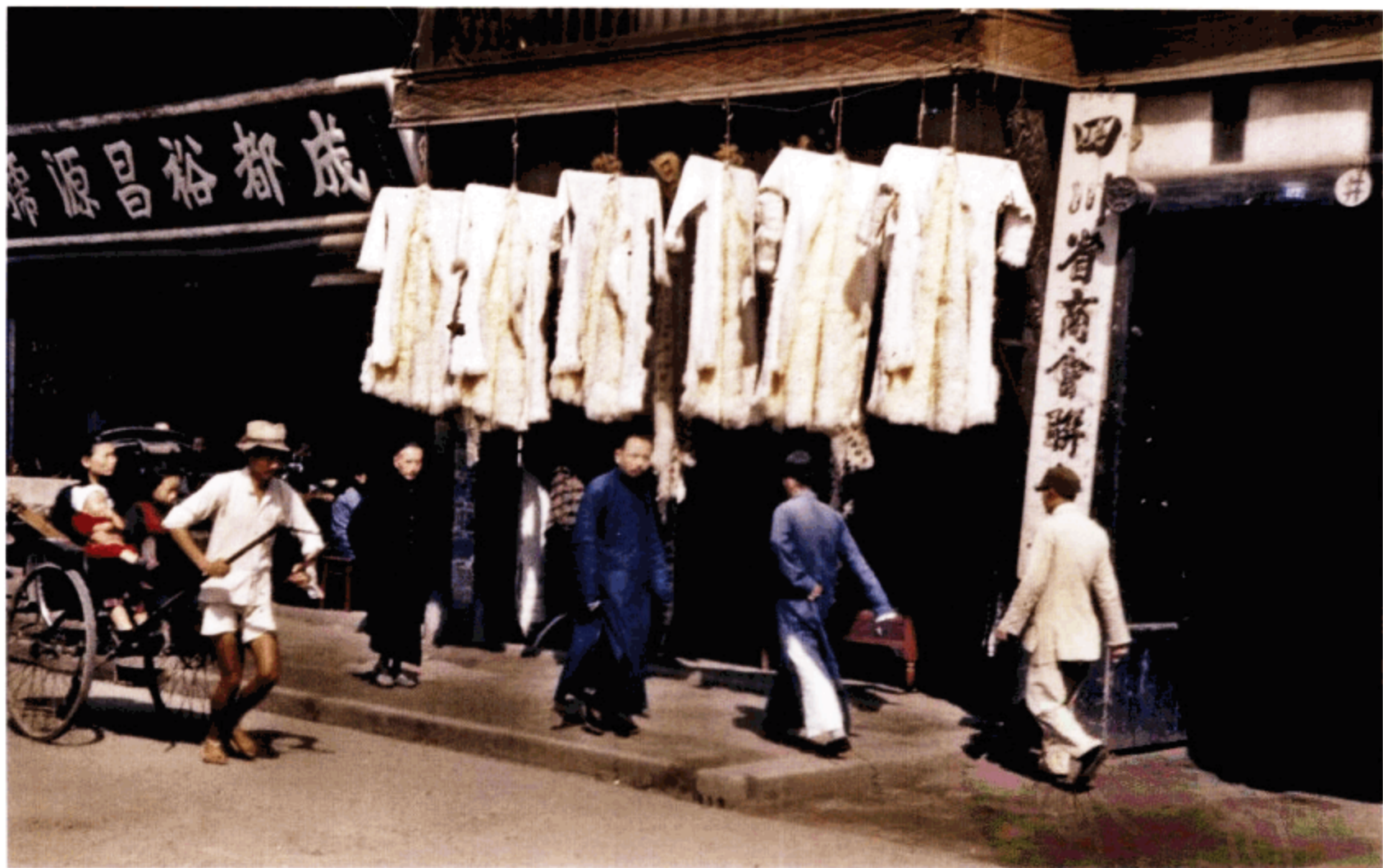
成都的商铺