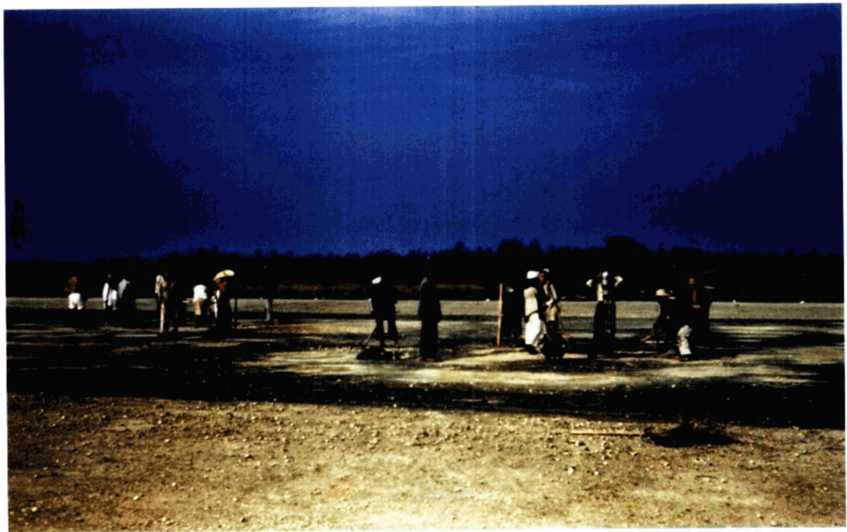
修筑空军机场的民工