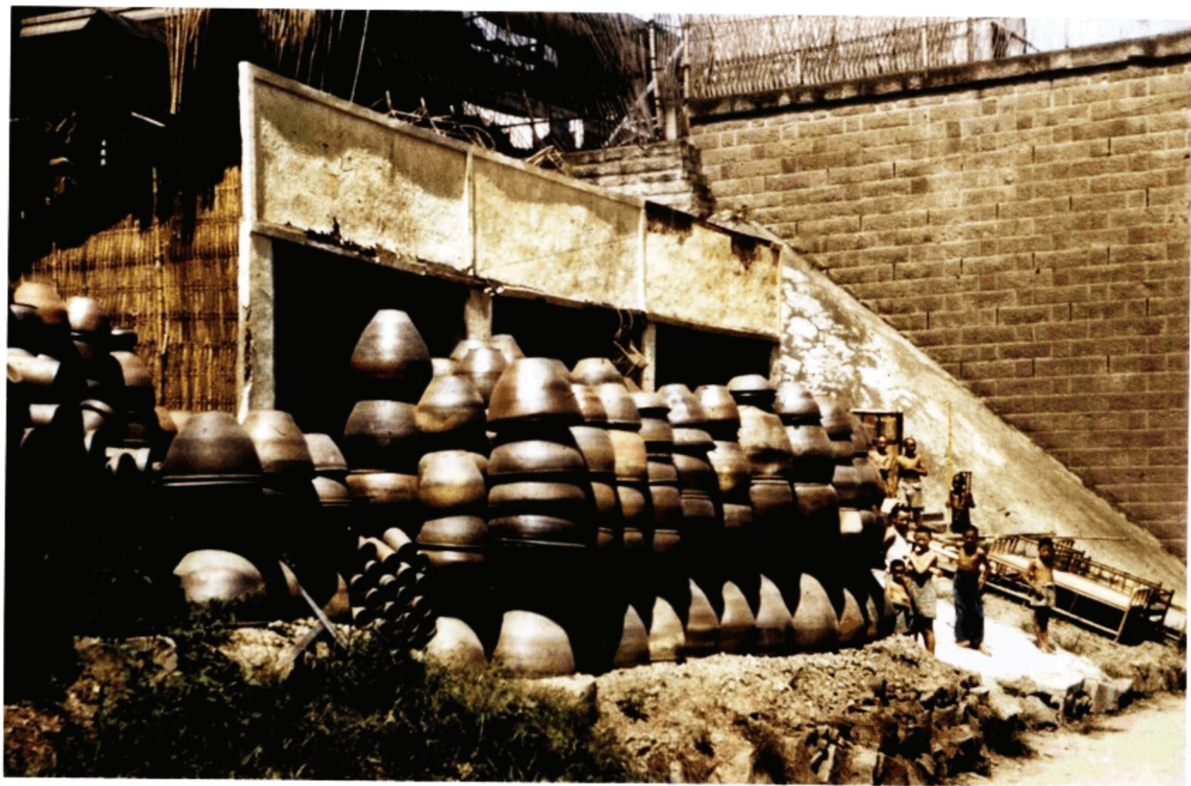
堆放陶瓷缸的仓库，小孩在好奇地看我们拍照。