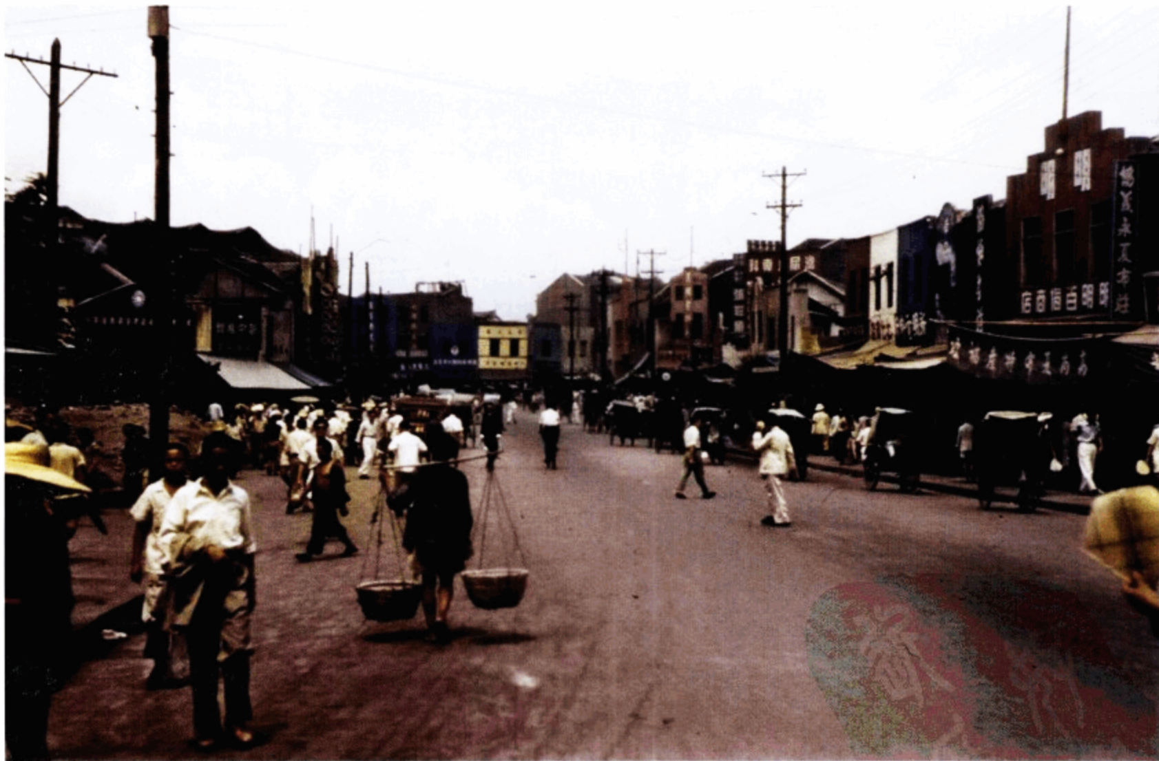
重庆街景