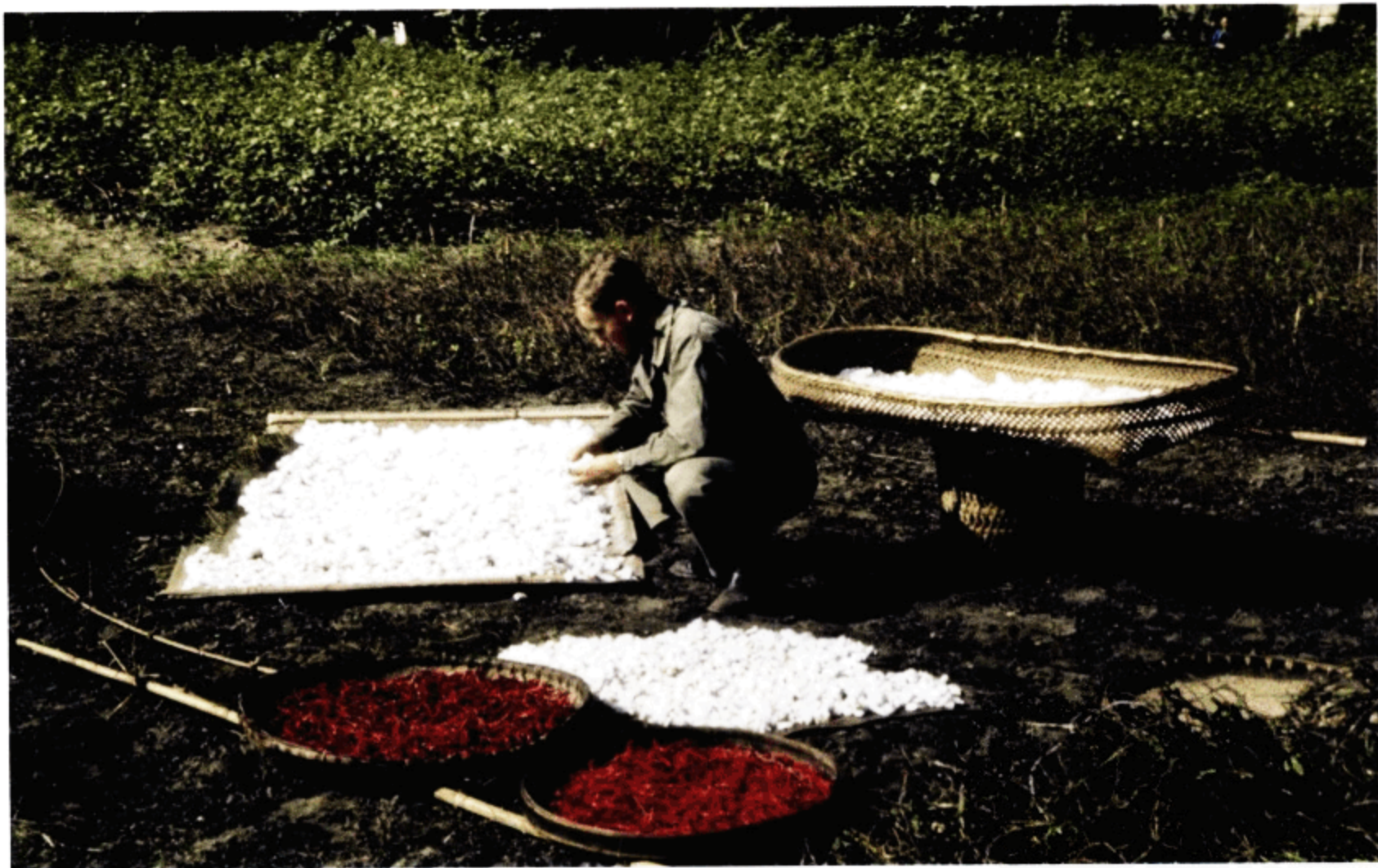
迪柏在帮助晾晒棉花和红椒