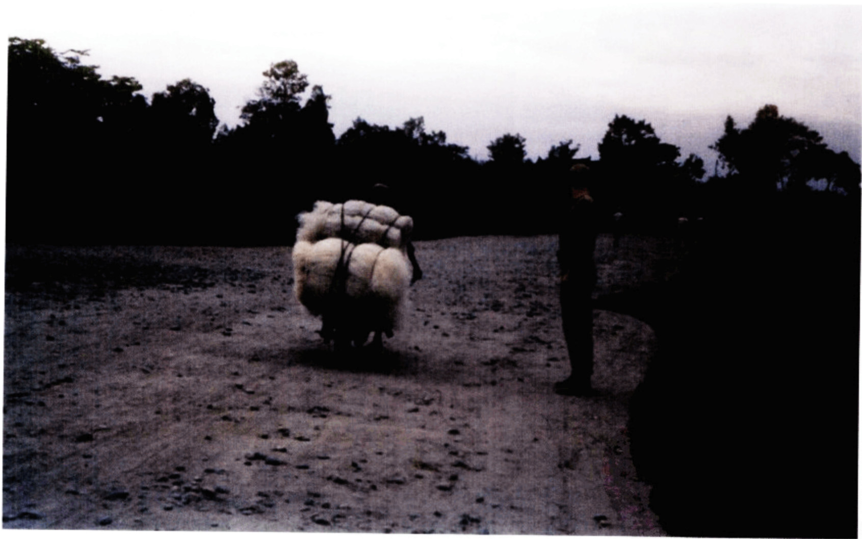
沙石路上推独轮车的民夫