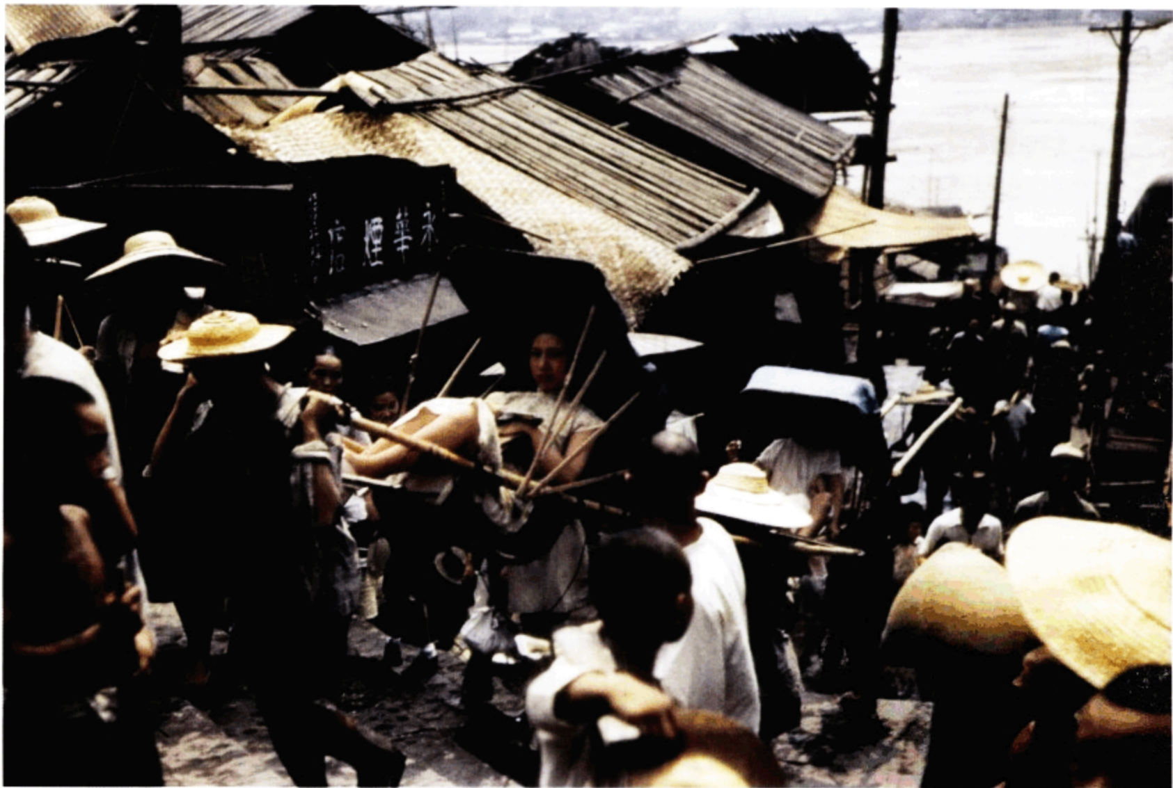
江边码头拥挤的巷道