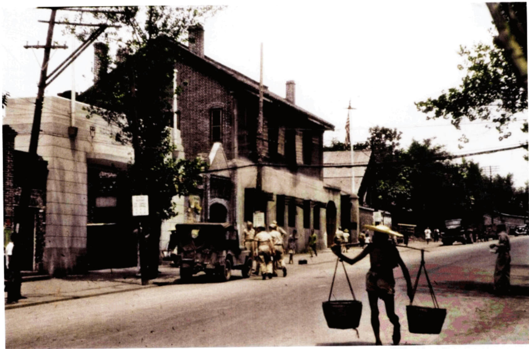
重庆街景