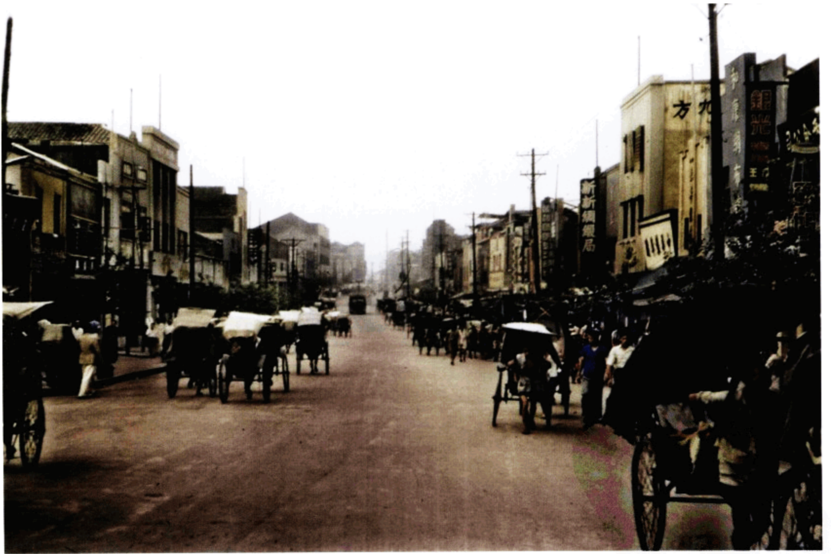
重庆街景