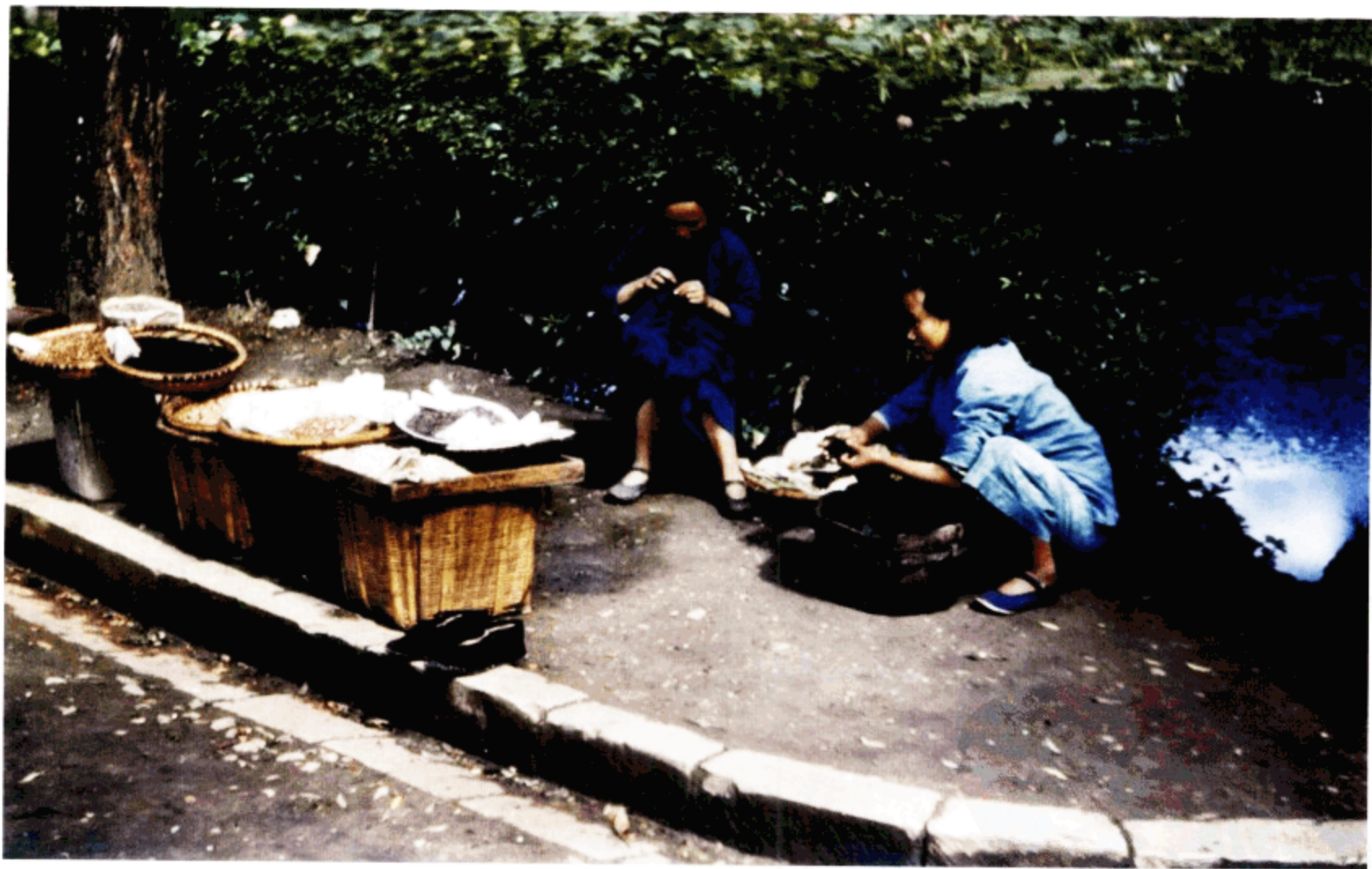
摆摊出售农产品的当地妇女