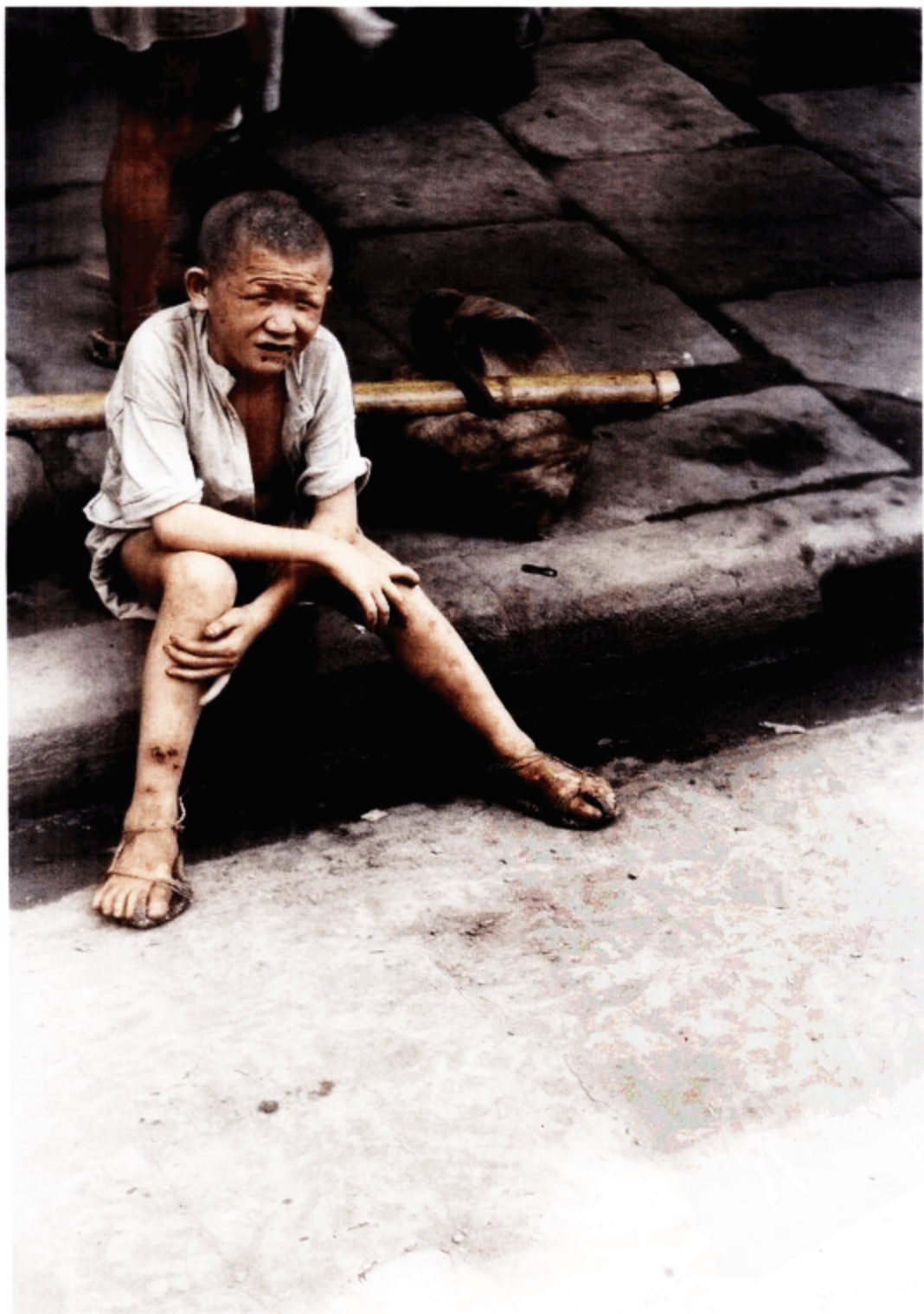
一个年轻的苦力在炎热的路边休息，旁边是他的担子。