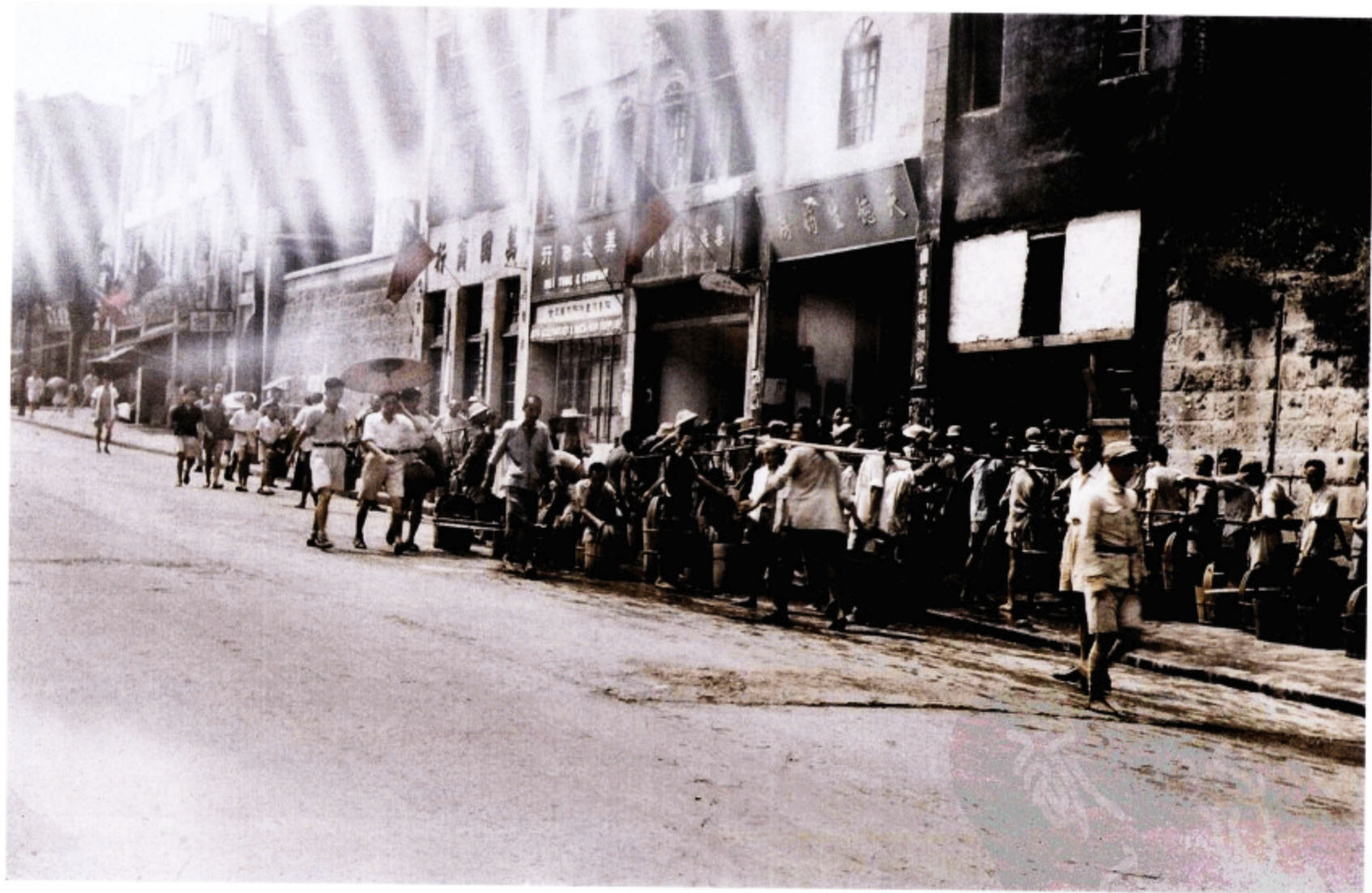
二战结束后的一段日子里，我们经常从白市驿的基地前往重庆游览。湿热的天气使我们了解这座城市以及饱受日军不断空袭磨难的市民。这张照片展现市民排着长长的队伍，在等待领取极少量配给的用水。