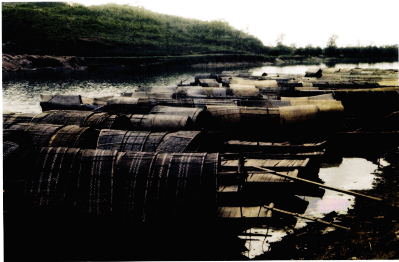
河边云集的小船