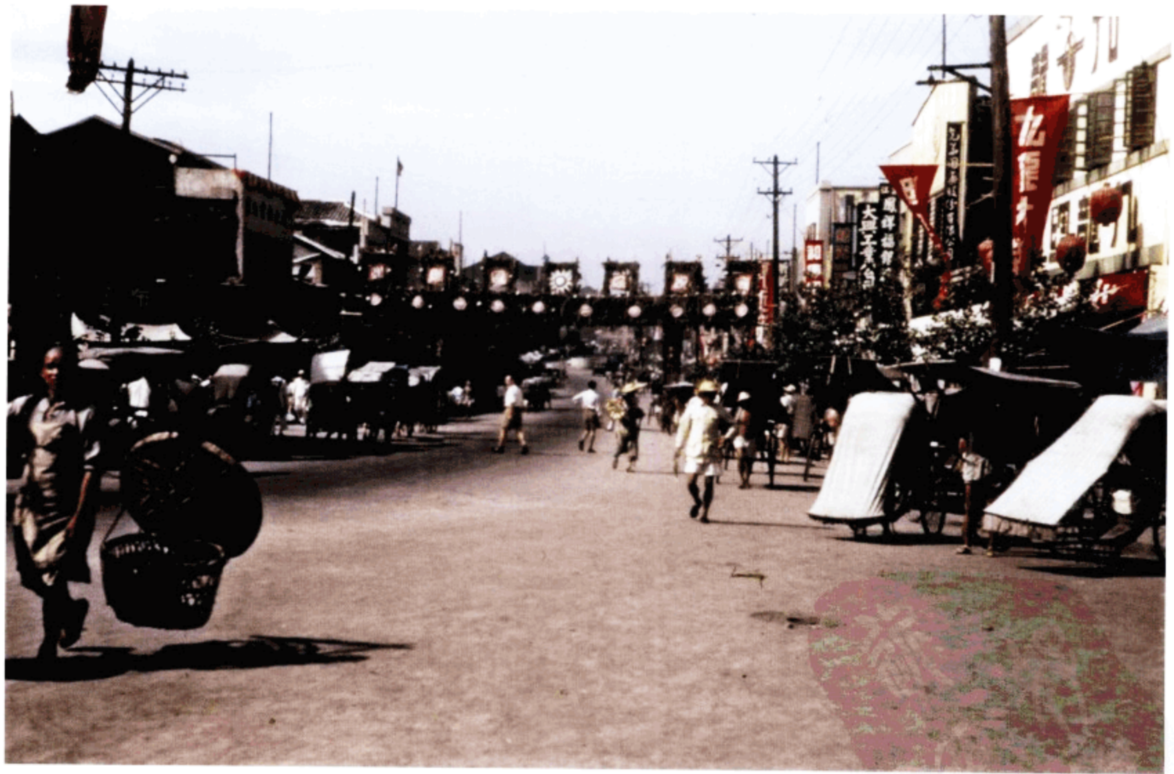
重庆街景