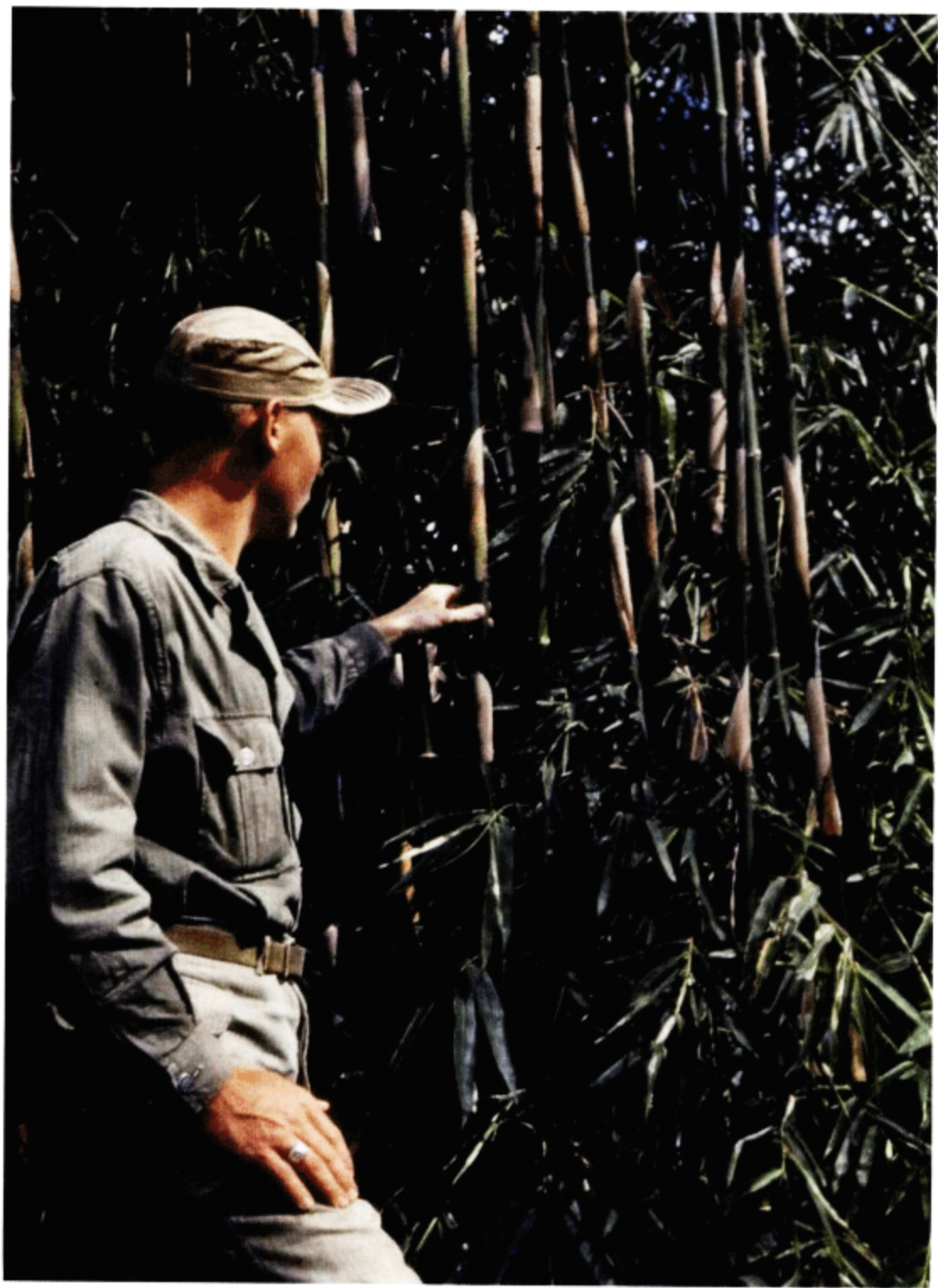
迪柏和竹林