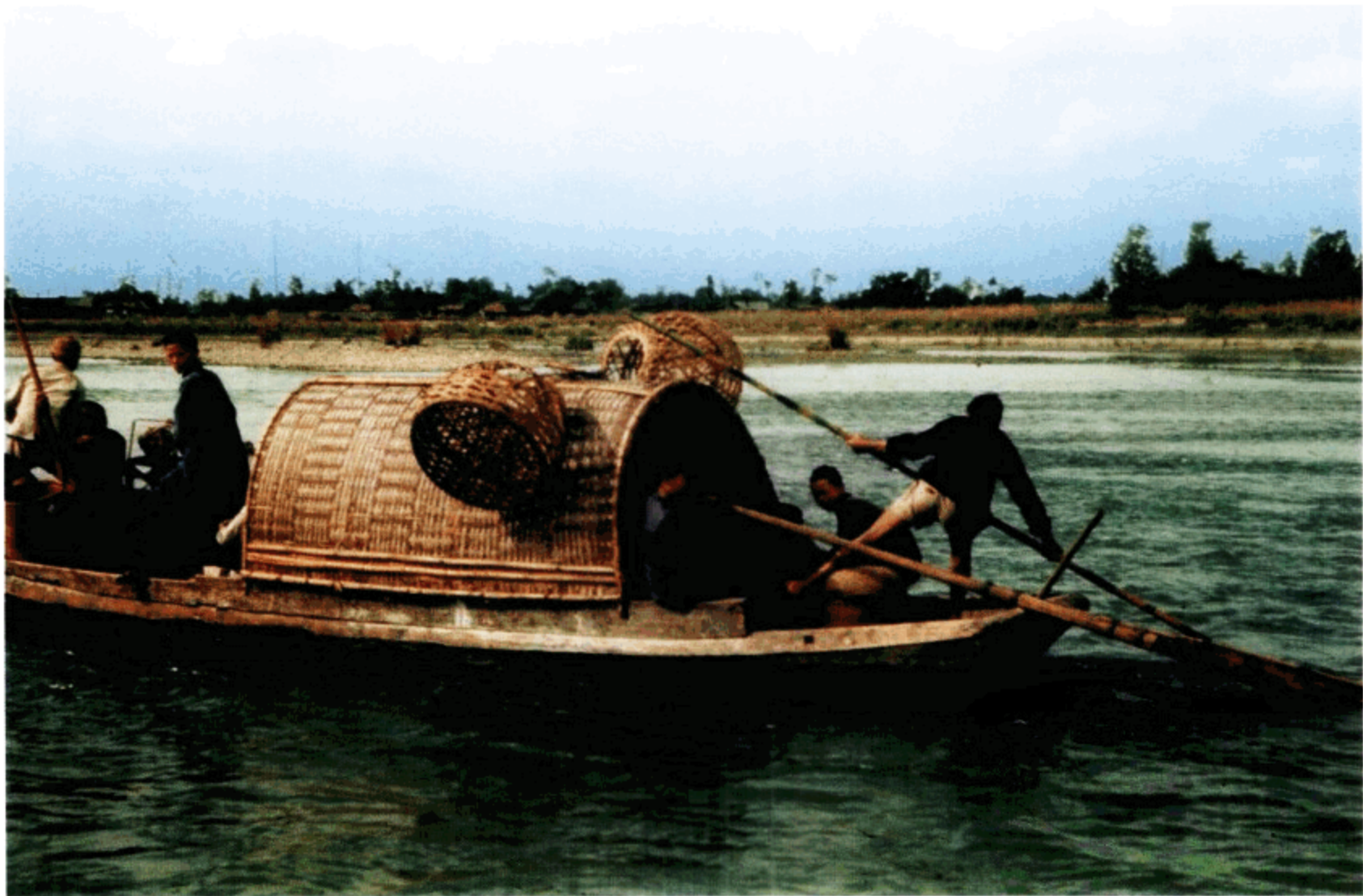
在南河（锦江）上