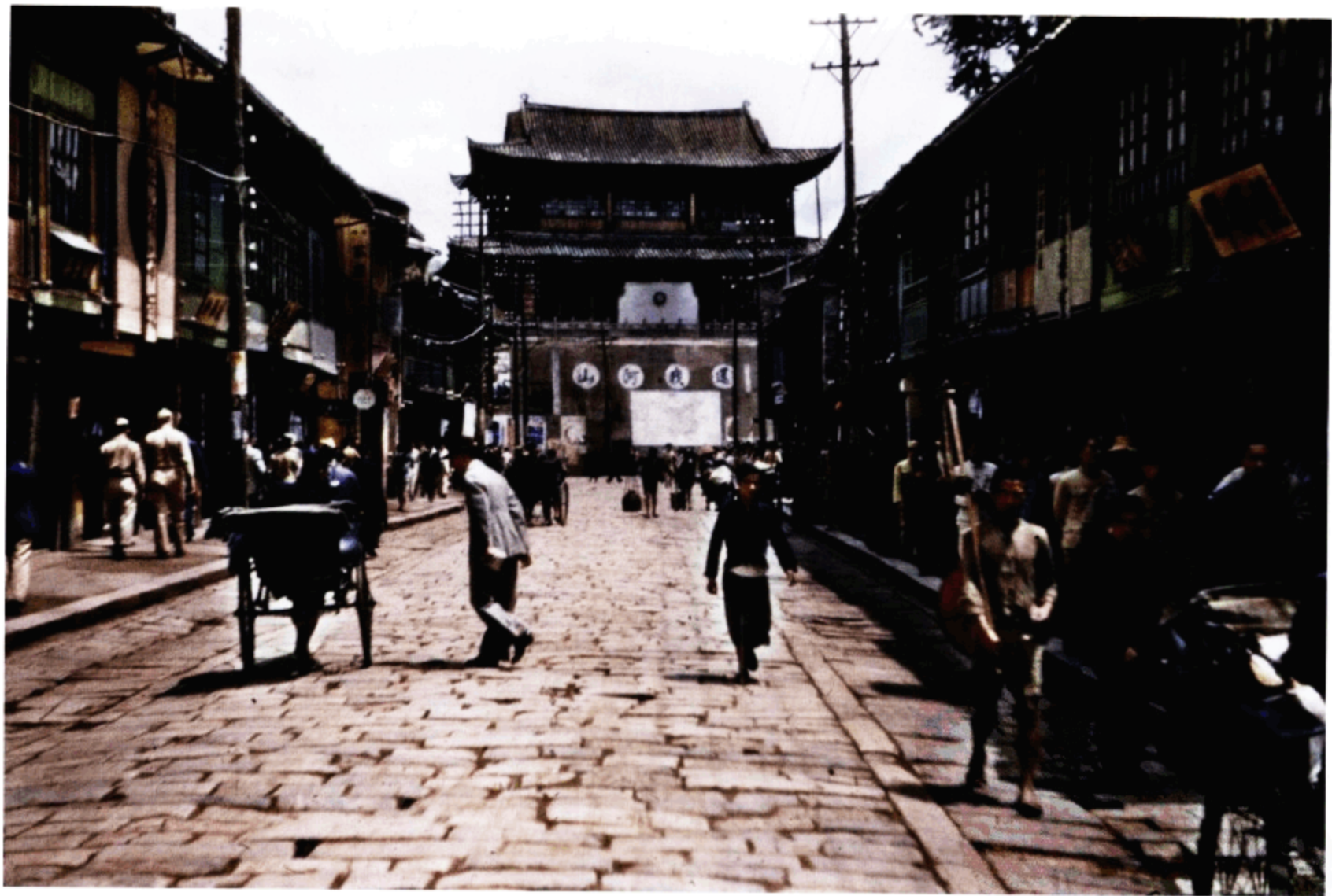
城门街景。城门上写有“还我河山”的标语。