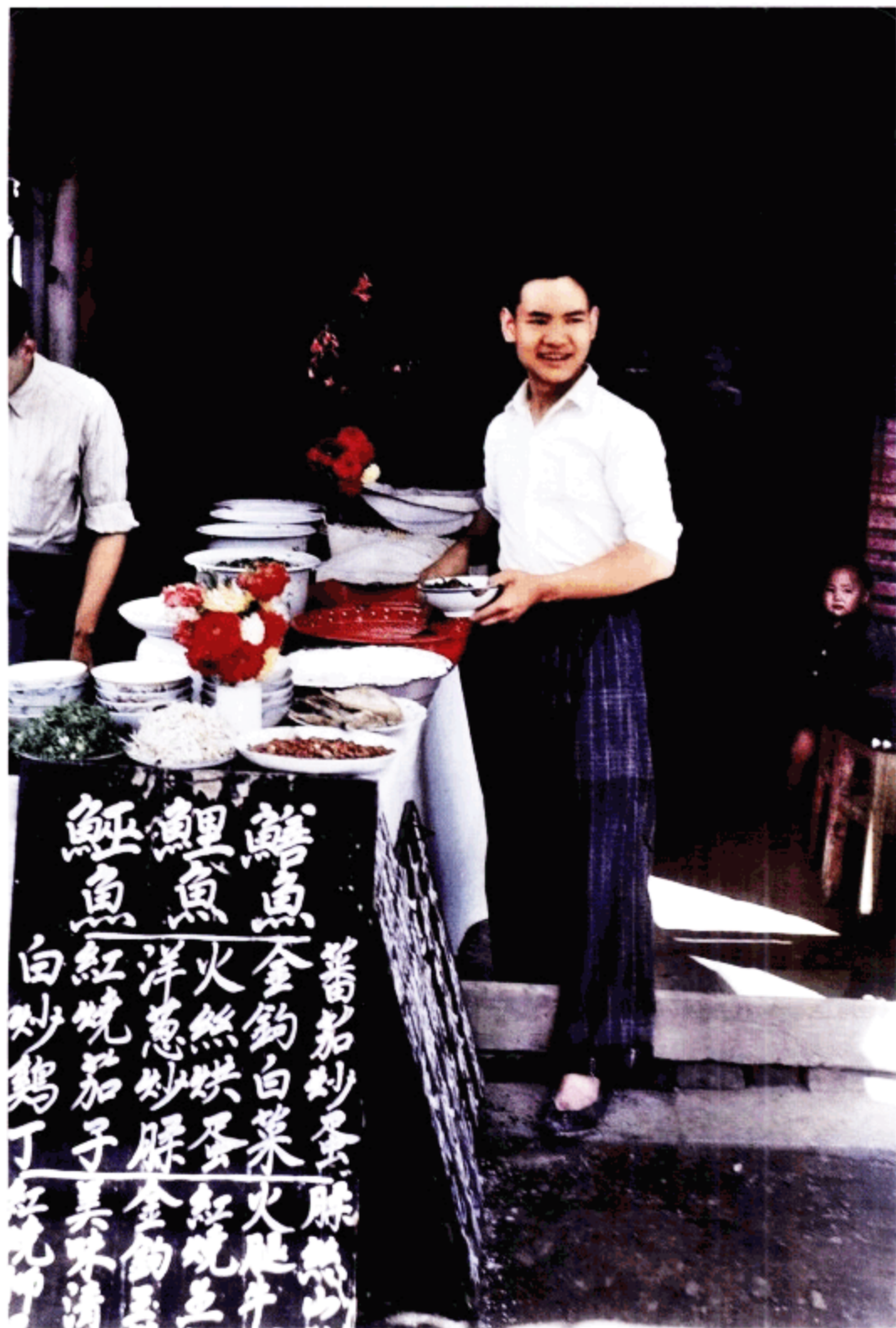
在滇池附近的公园里，餐饮店和小贩比比皆是。他们在小屋里营业，在诱人的美食旁放着黑板，上面是用粉笔写的菜单。