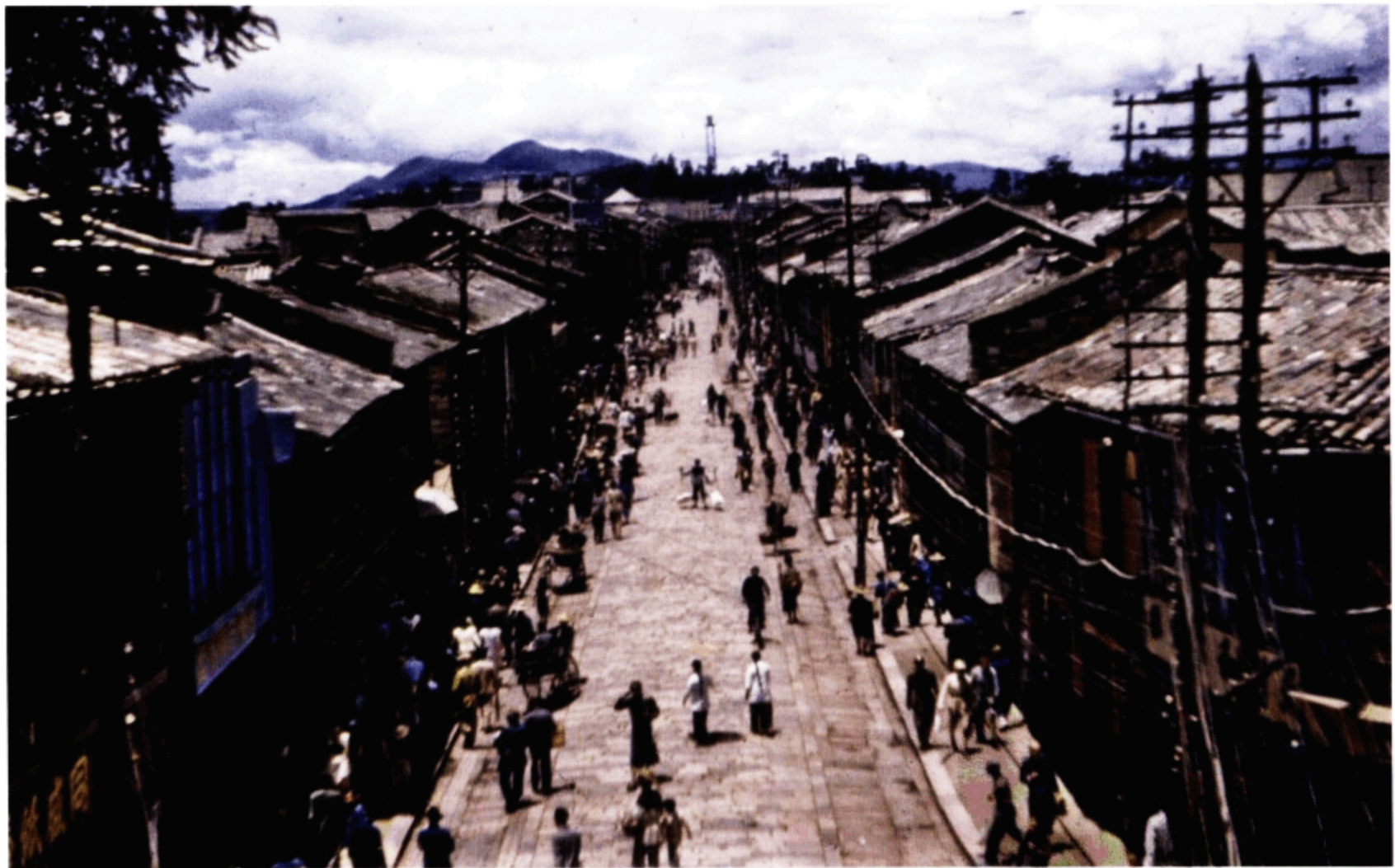
通到昆明的“滇缅公路”街道景象