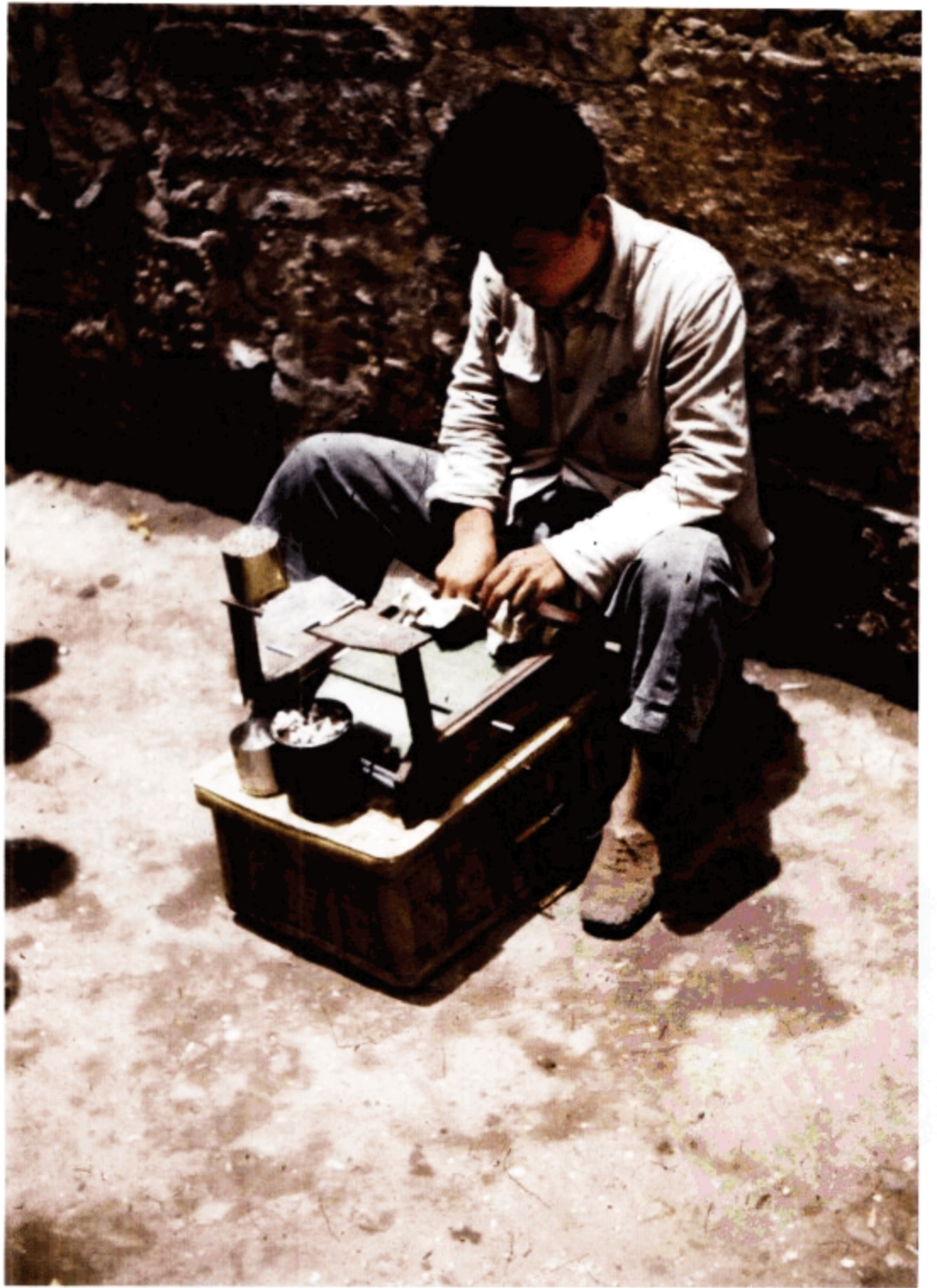
路边制作香烟的小贩