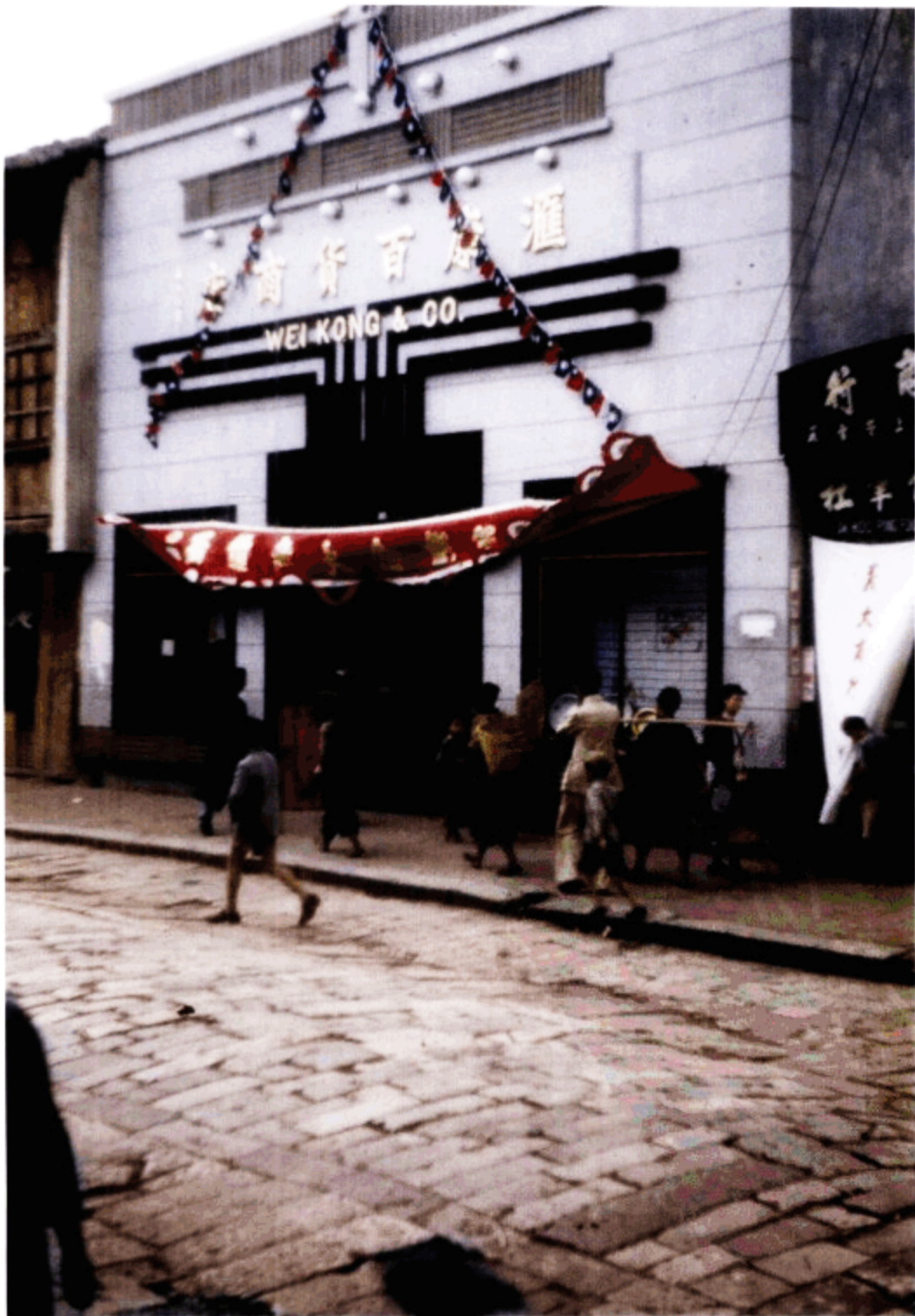
百货商店