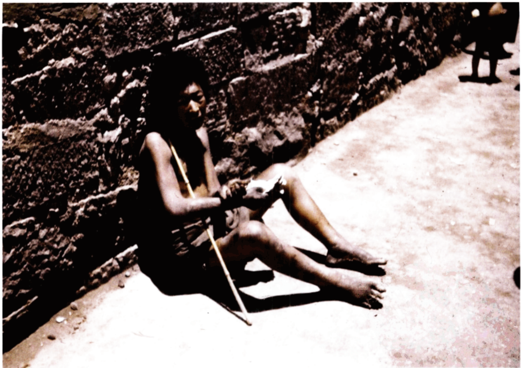
流离失所的乞讨者