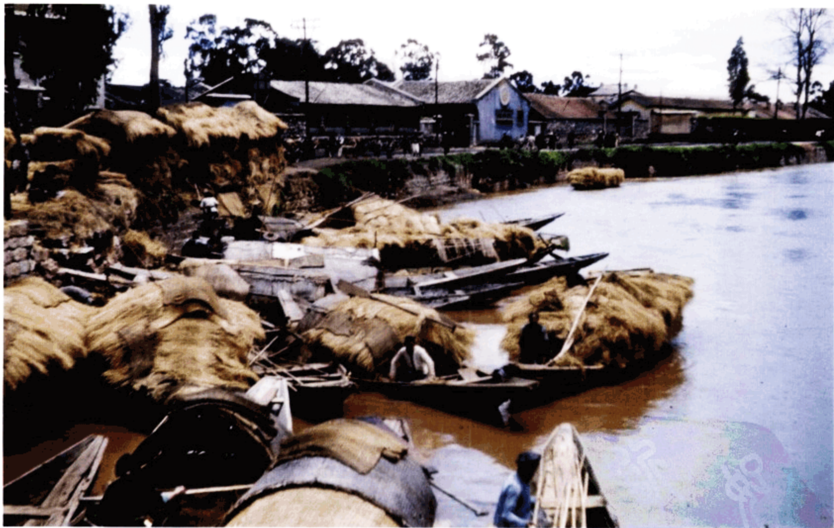
运河上装运稻草的小船