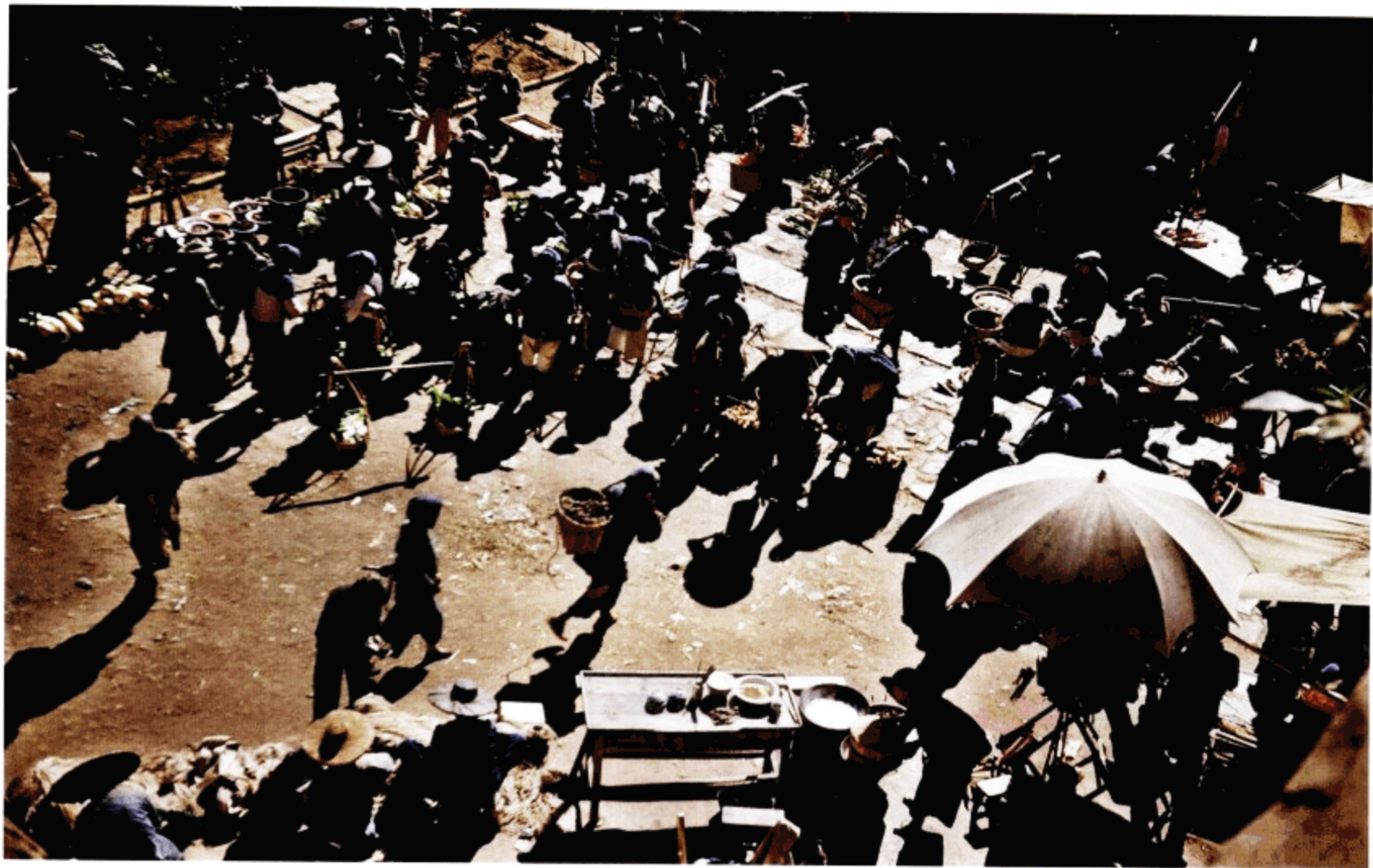
城门内的集市