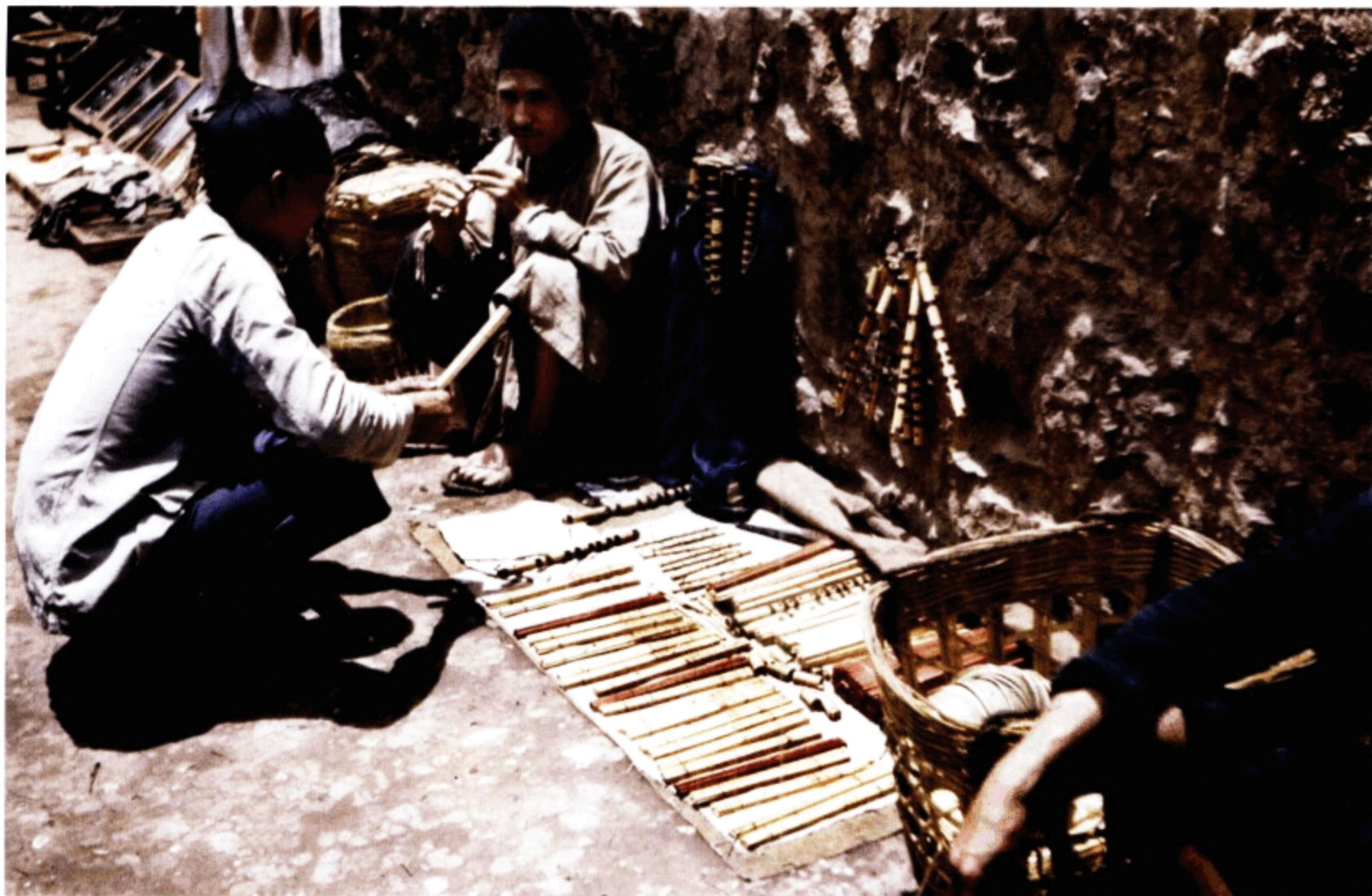
路边小贩在兜售自制的笛子