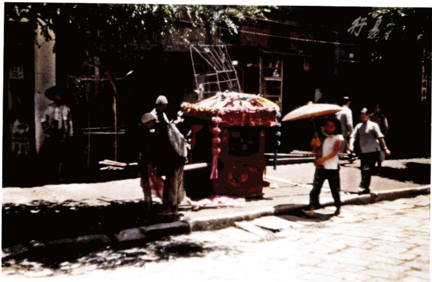
1944年11月间，在昆明的某家商店门口有一座色彩鲜艳，用纸花装饰起来的大花轿子。由几个壮汉抬着去举行婚礼。