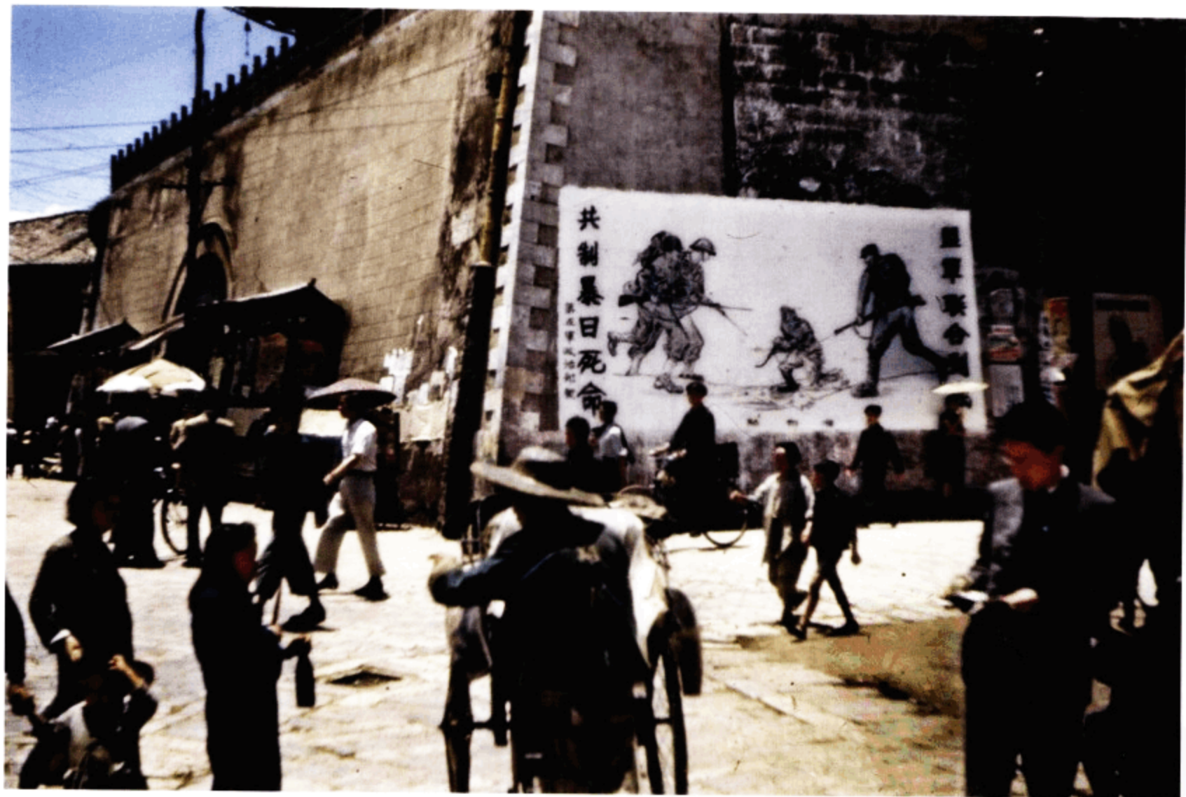
城牆上的抗日海報和標語