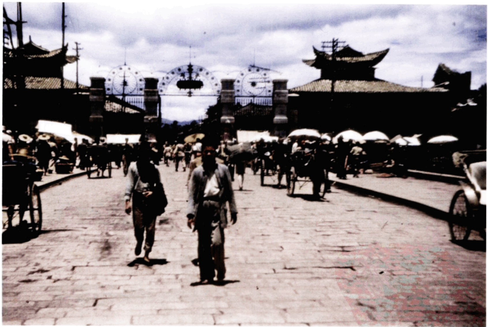
铁饰大门前的街景