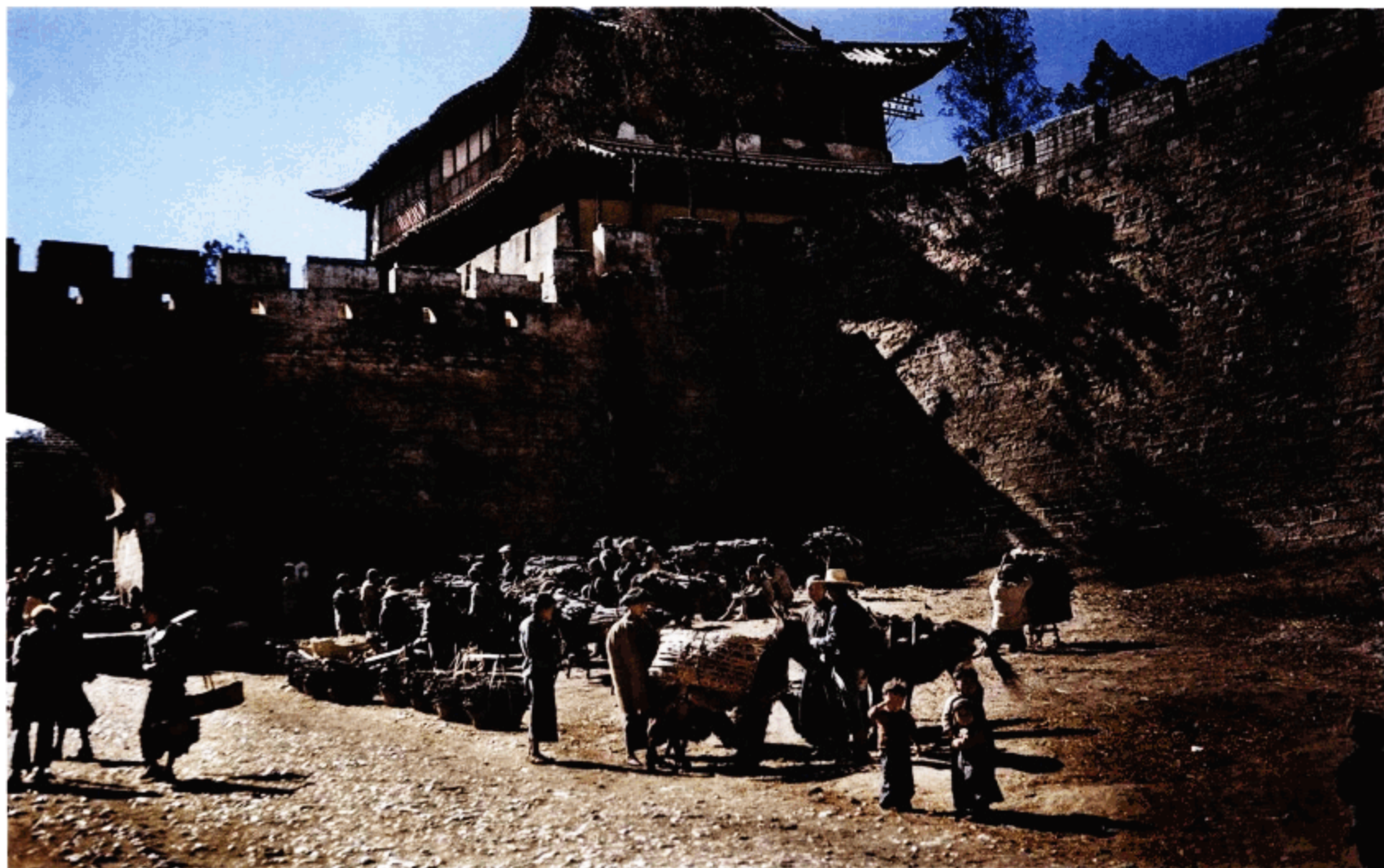
拥有六道门的昆明古城墙，建于公元8世纪。这是在其中一道城门外拍摄的集市场景。