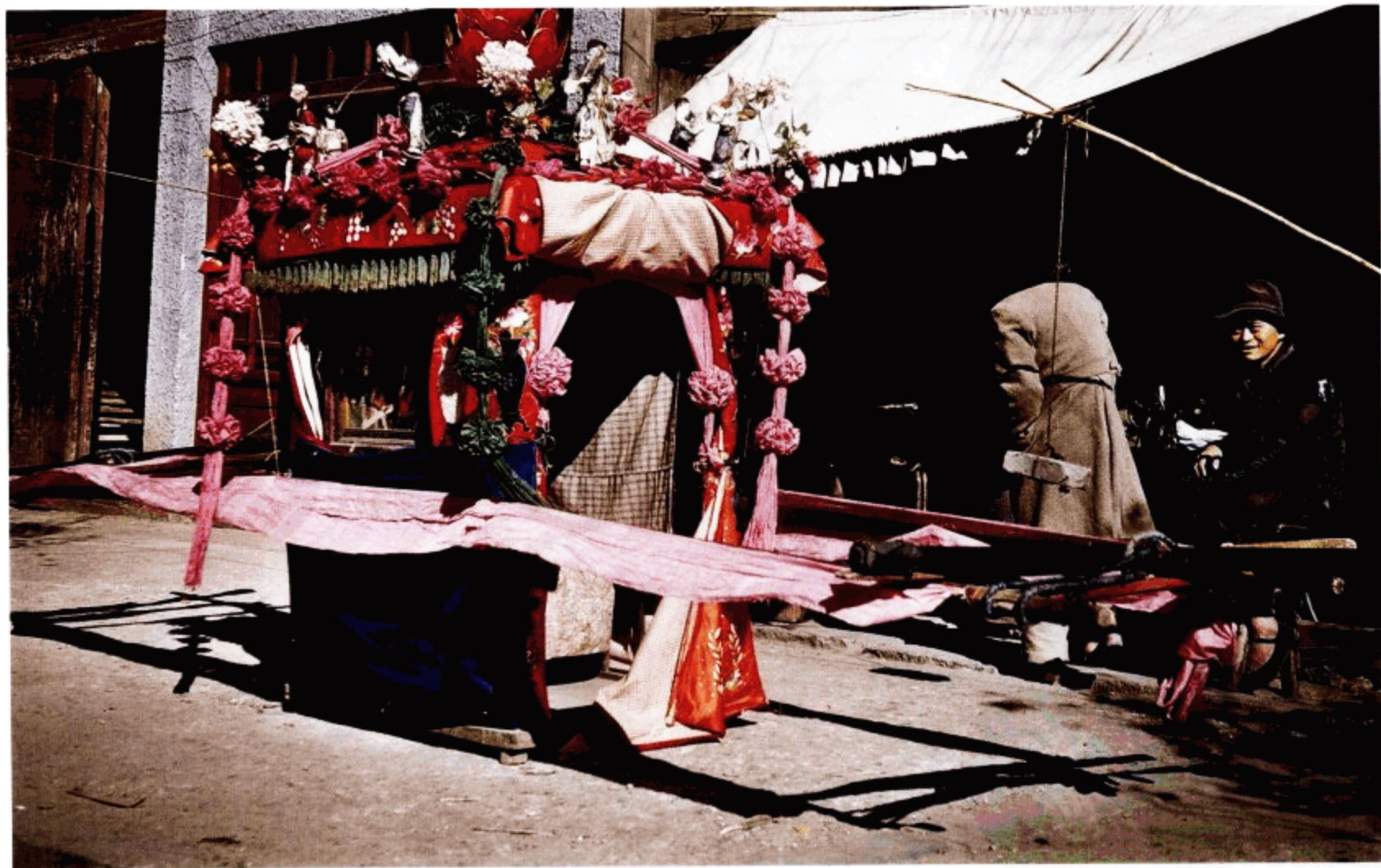
在昆明市内见到的另一个花轿