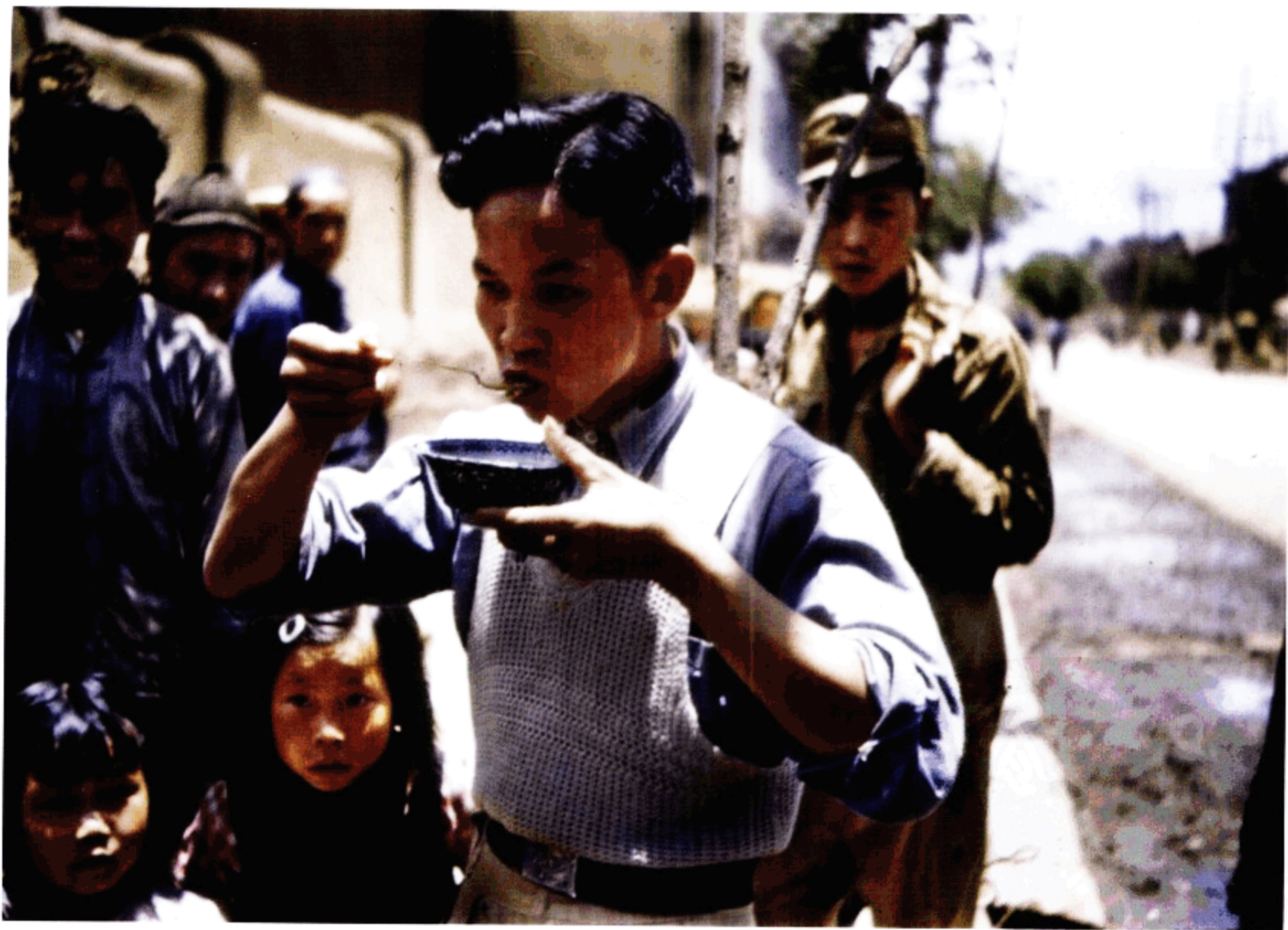
品尝美食