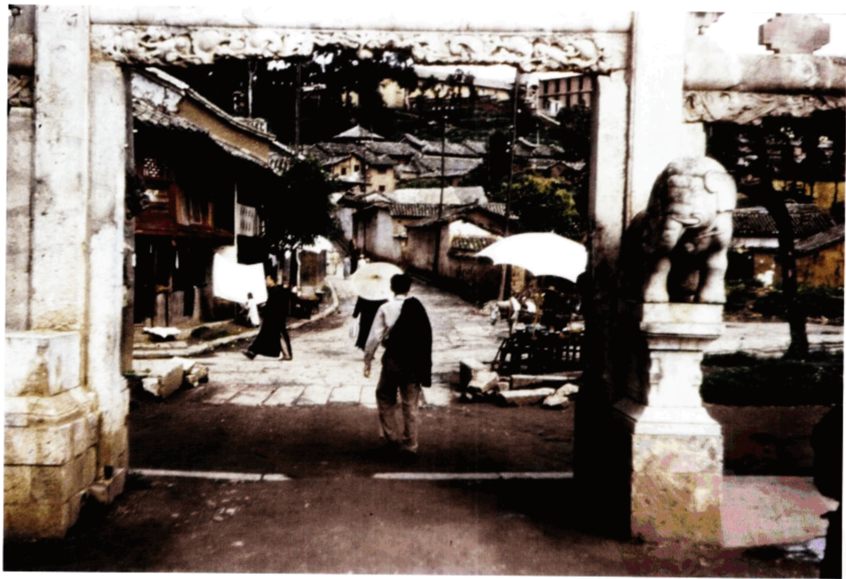
石牌坊后的居民区