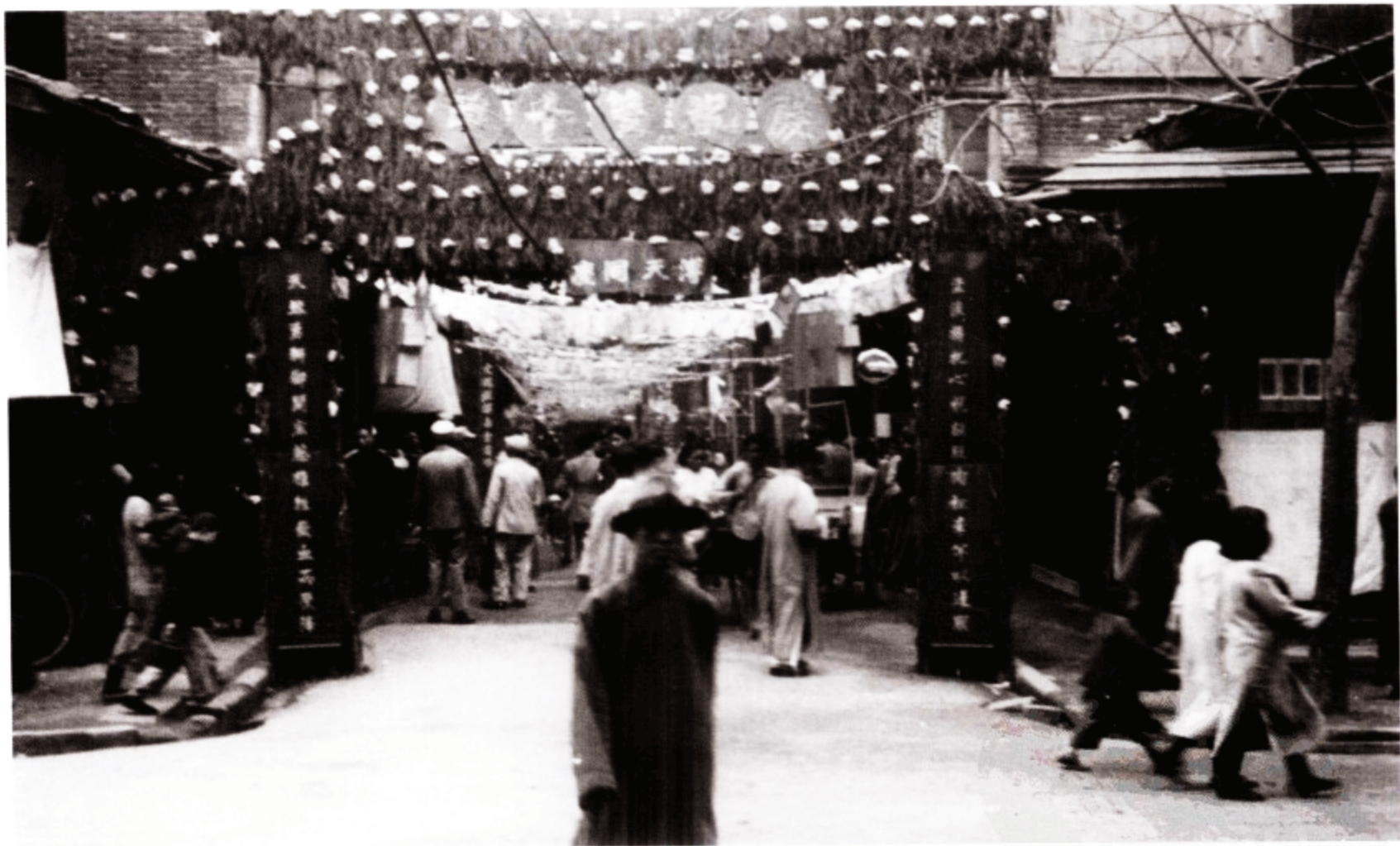
昆明街景