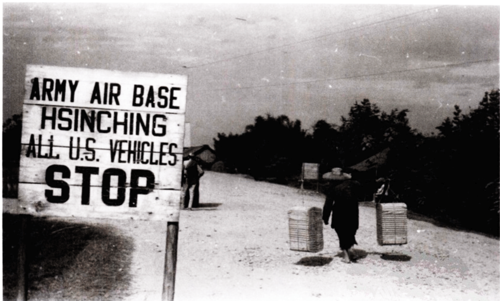
新津空军基地