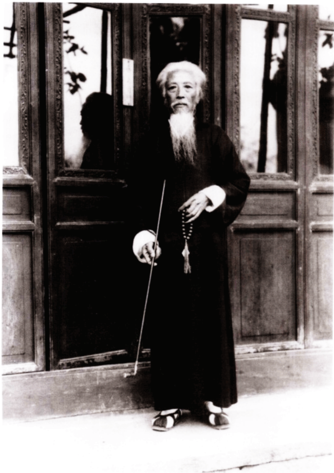
昆明的老人