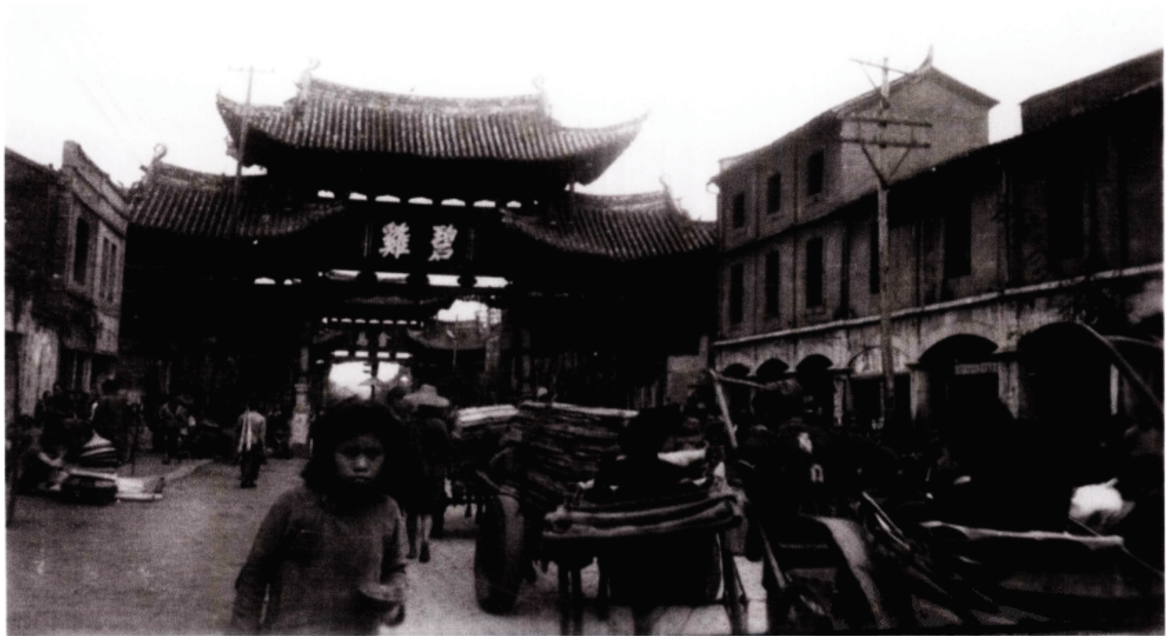
昆明街景