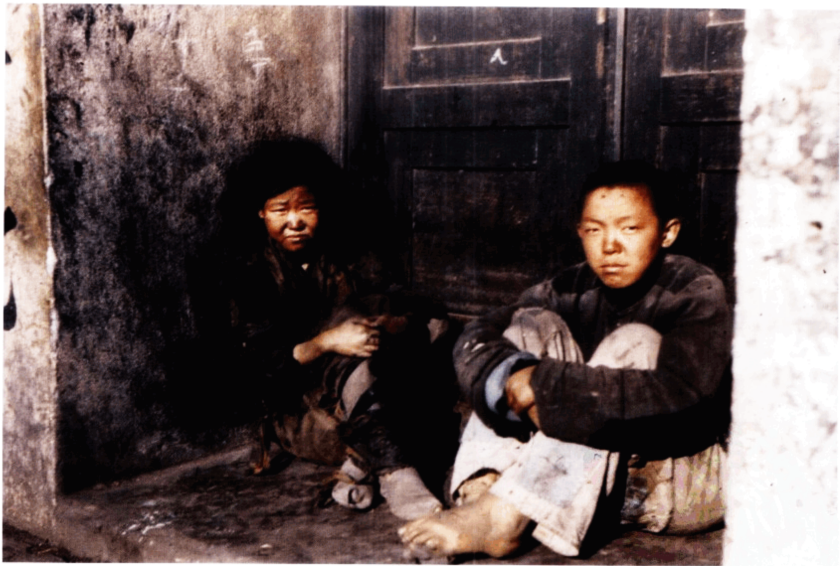
苏州河边蜷缩在大楼门口的流浪儿童