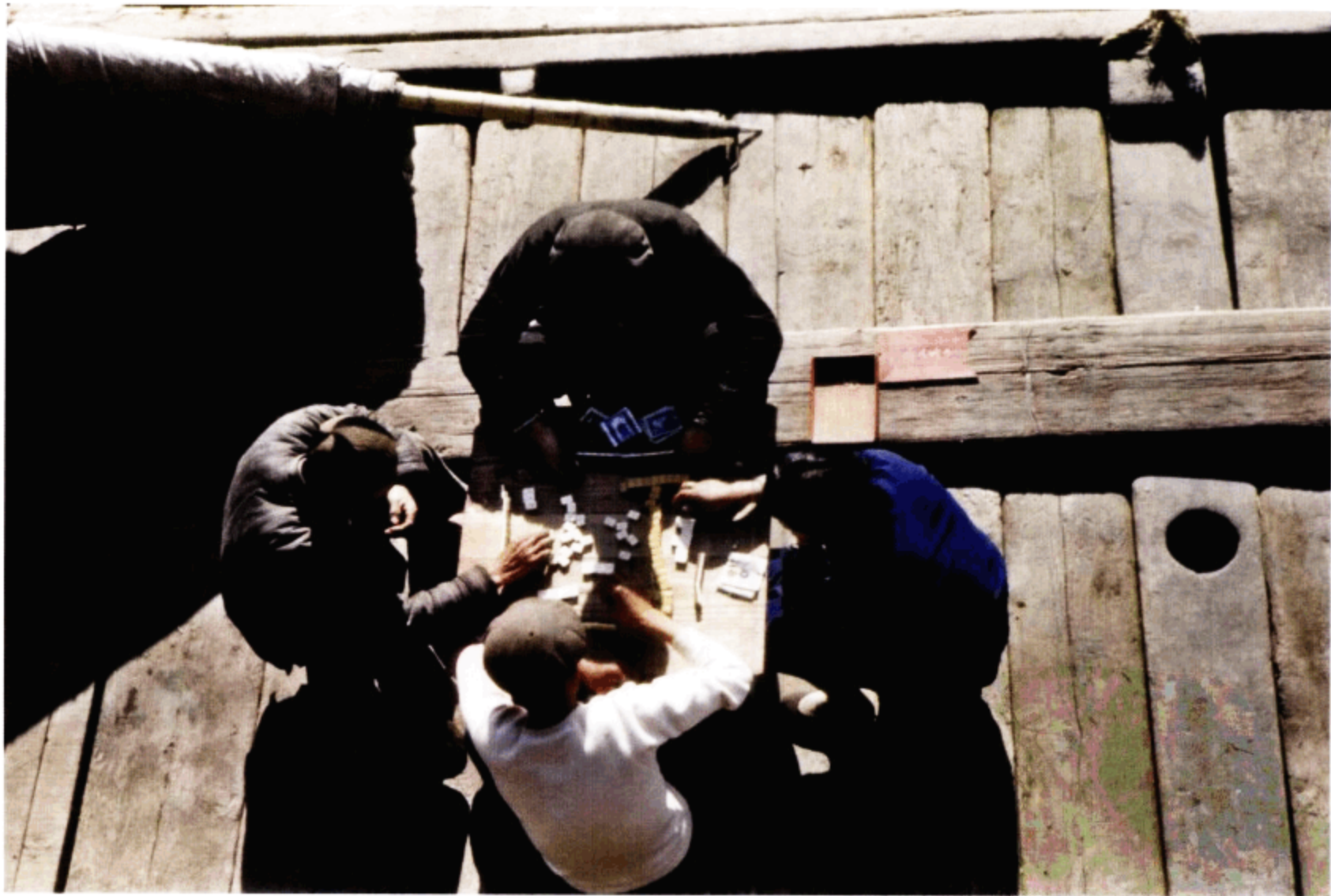
苏州河，船上的娱乐活动——打麻将