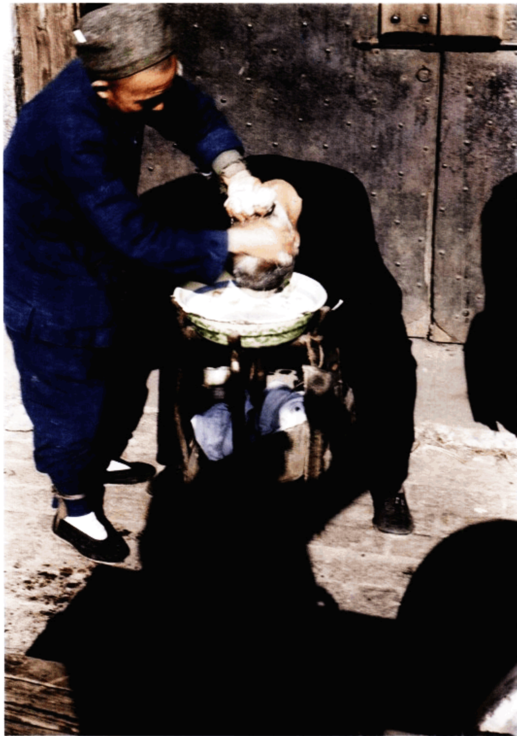
苏州河边剃头师傅在为客人洗头