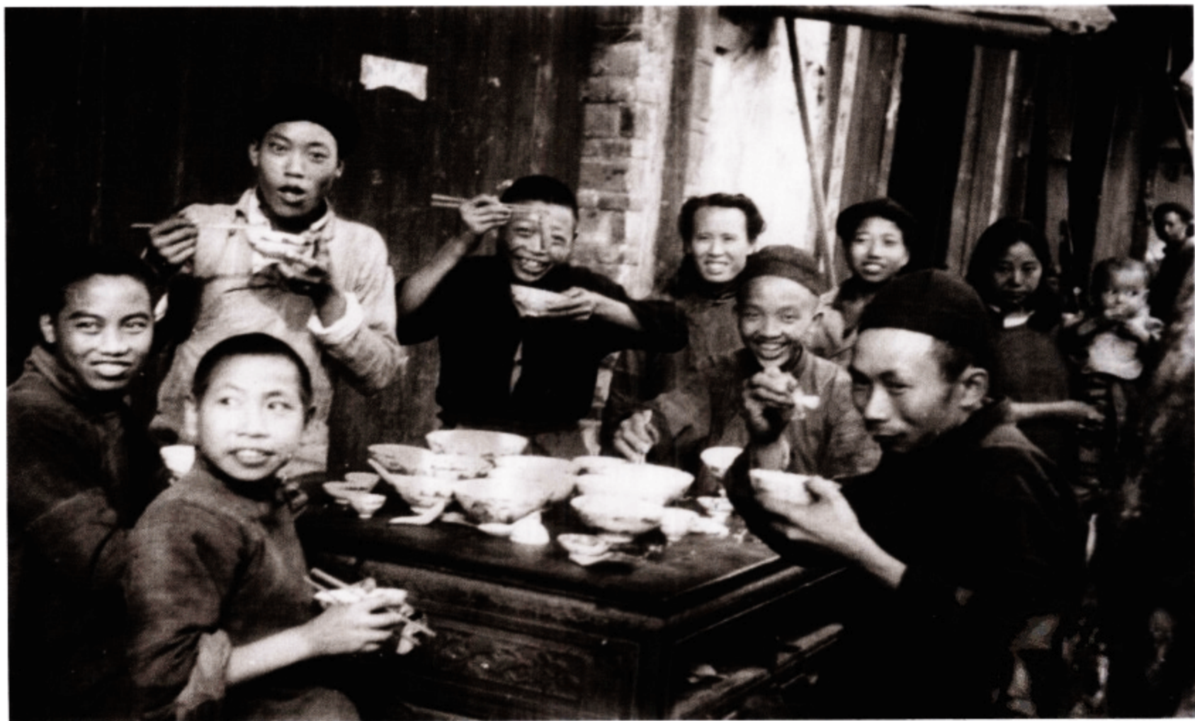
街边吃饭的昆明市民（艾伦·拉森 摄）