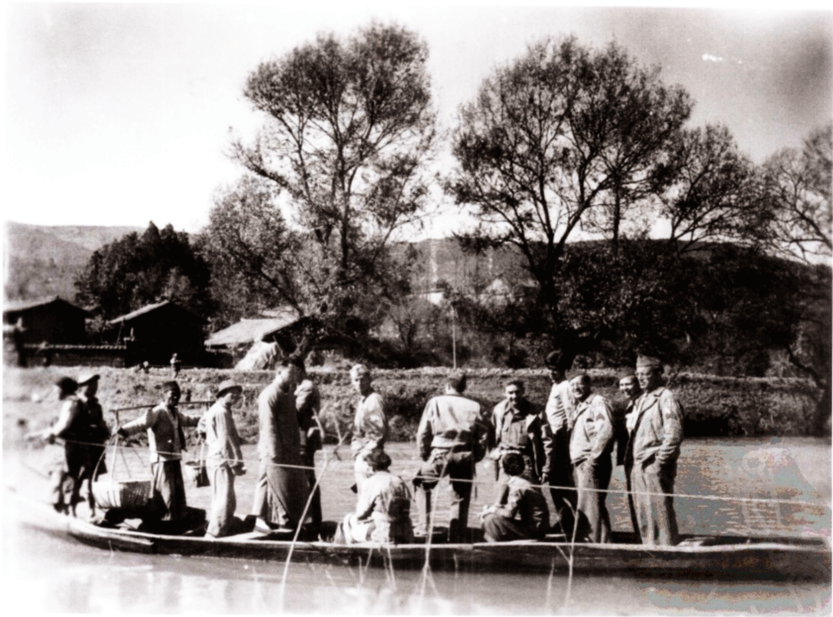
飞虎队员在云南农村乘坐小船渡河