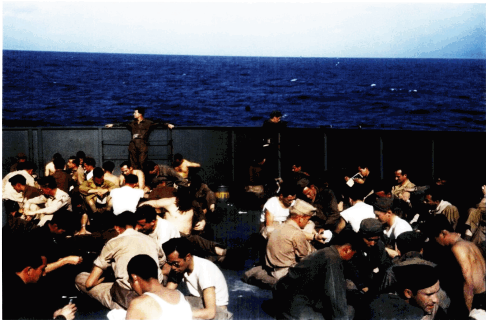
美军士兵在军舰甲板上玩扑克。