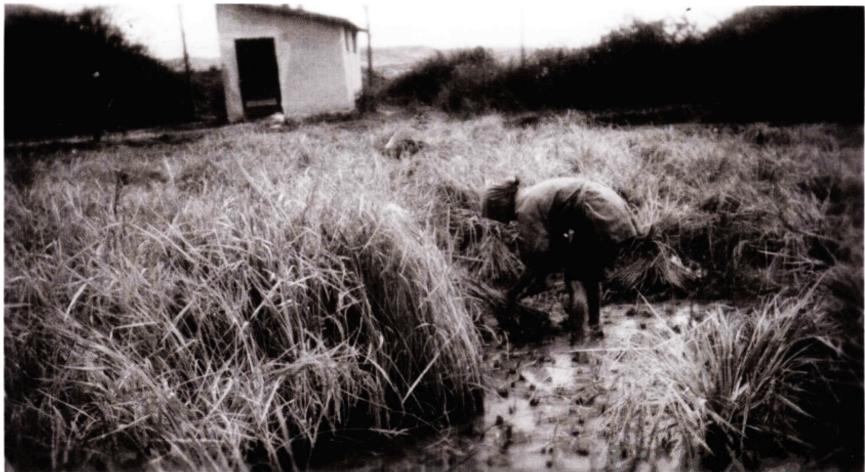
昆明空军基地美军兵营附近的稻田