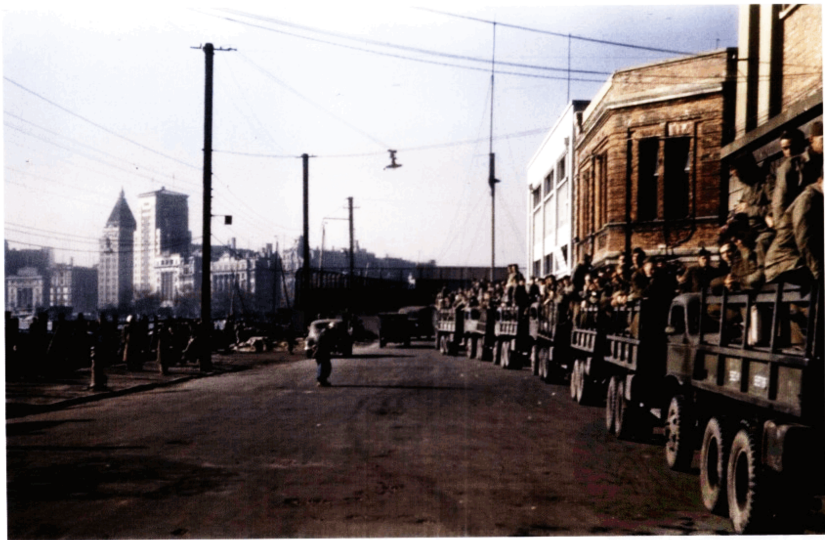
1945年12月15日，运送美军去美国军舰的车队