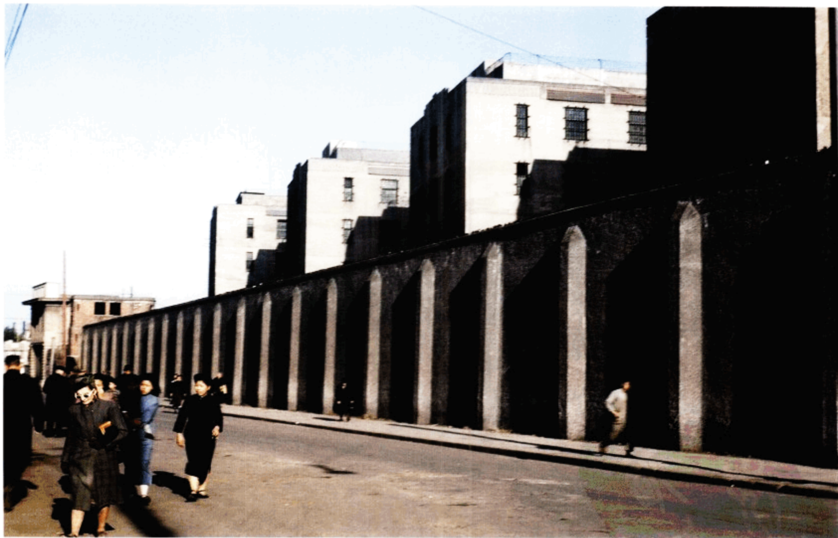
有一天，我们到了虹口区，诧异地看到了一座大型监狱（即提篮桥监狱），旁边是红砖建筑，类似仓库的房子。