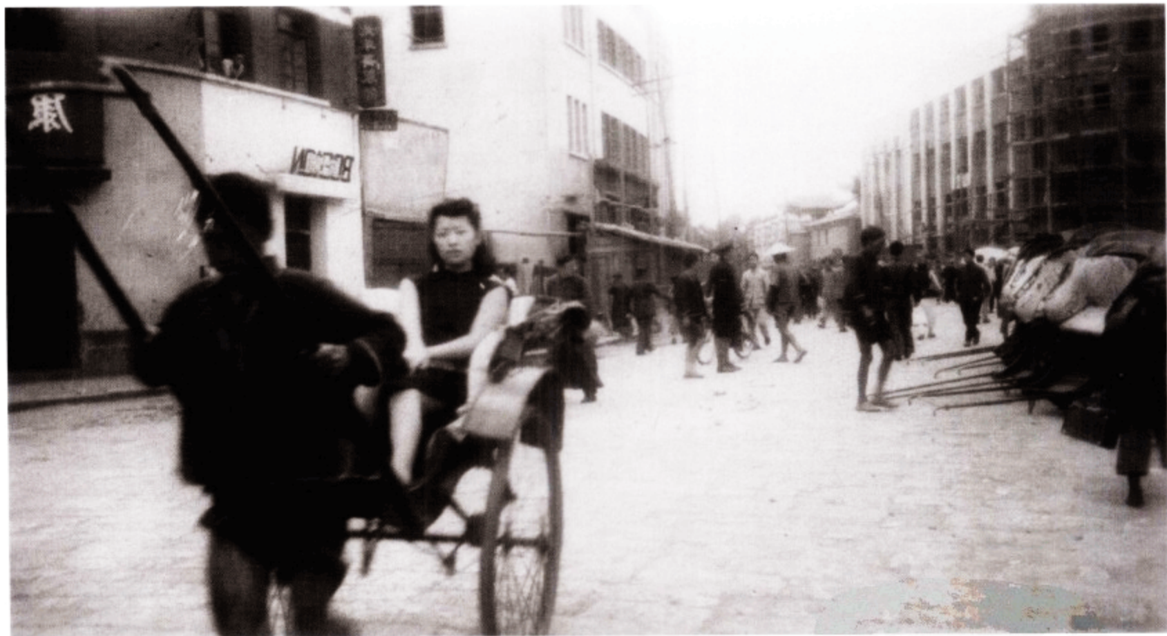
昆明街景