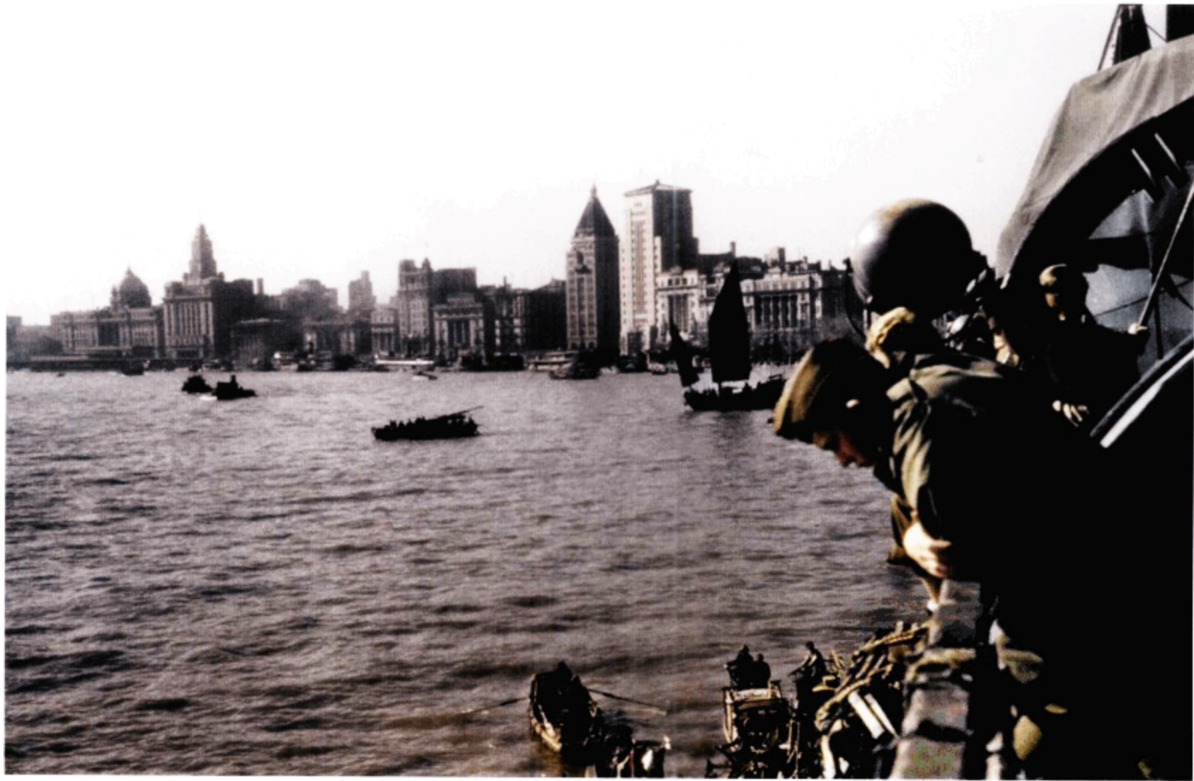
从美国运输舰上看到的外滩和黄浦江景象