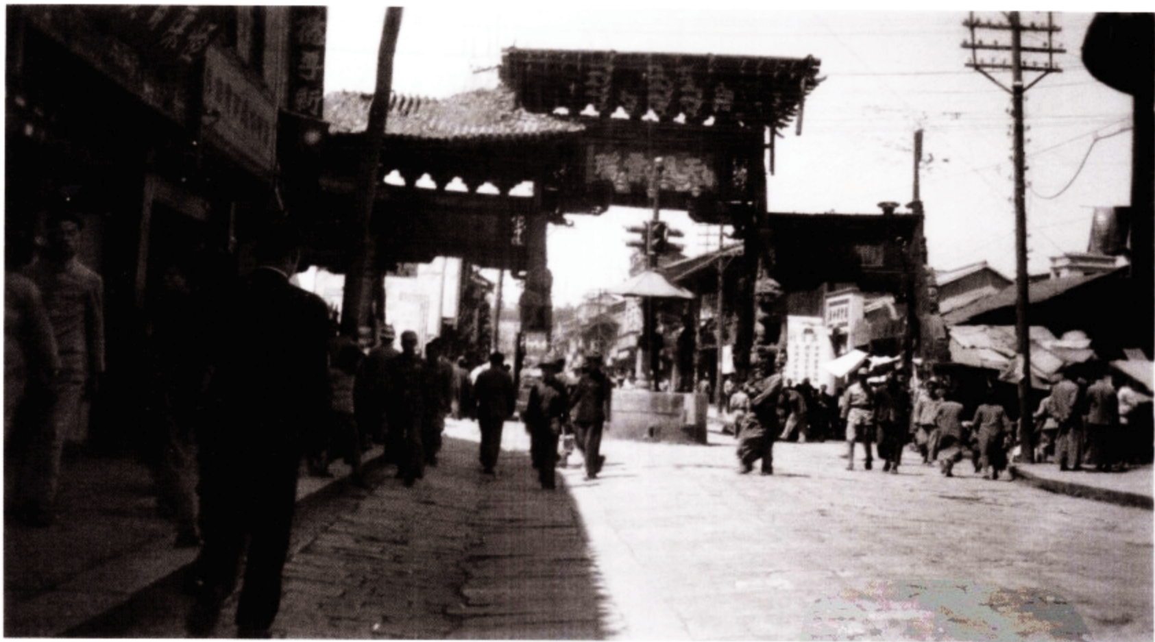
昆明街景