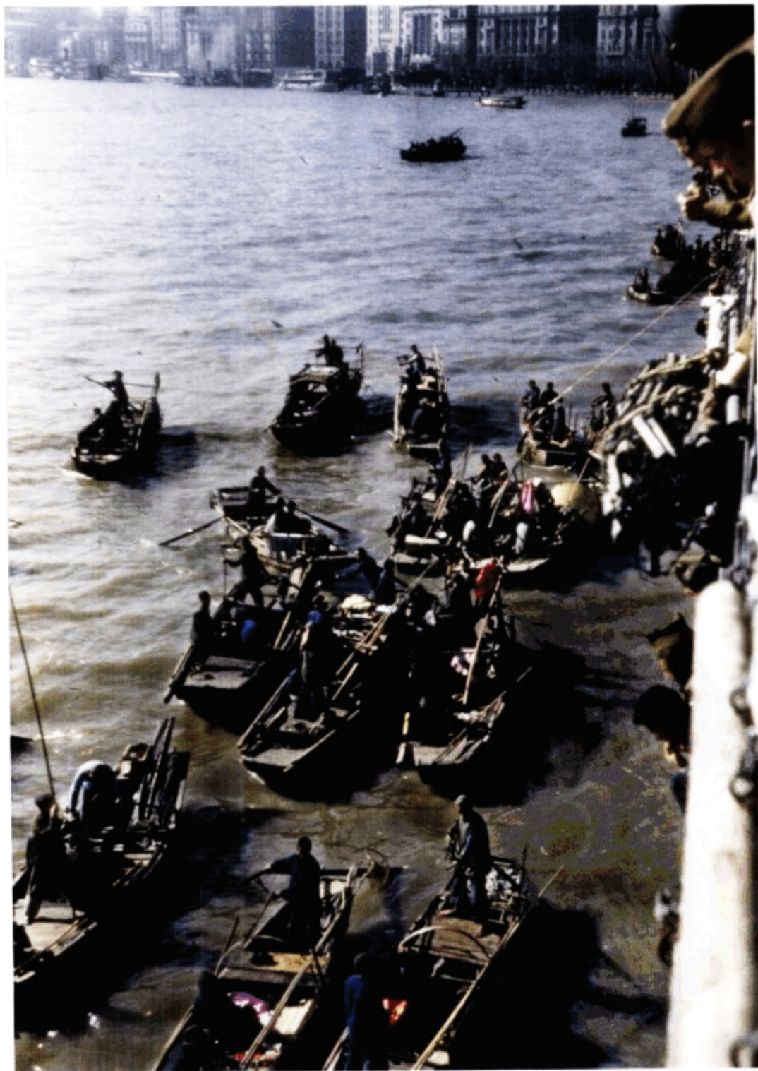
水上商贩在向准备离开中国的美军士兵兜售商品。