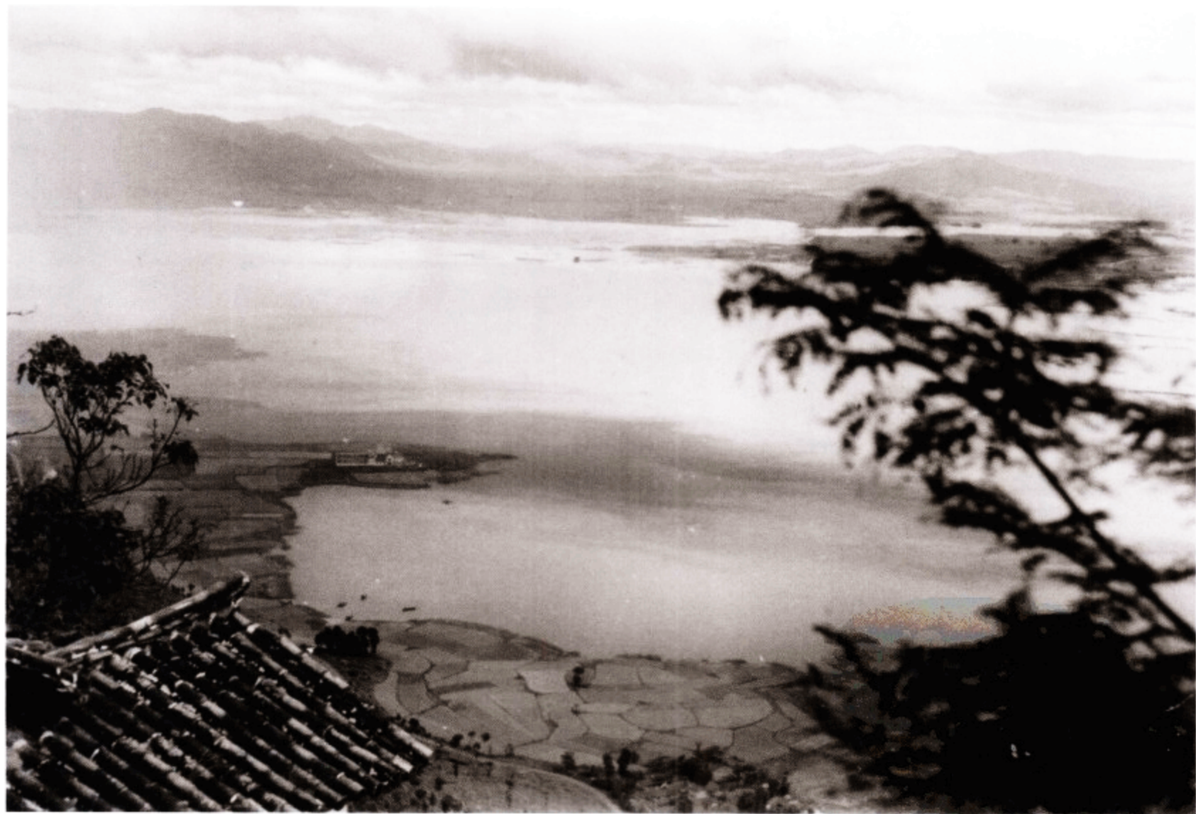
从昆明西山寺庙俯瞰滇池