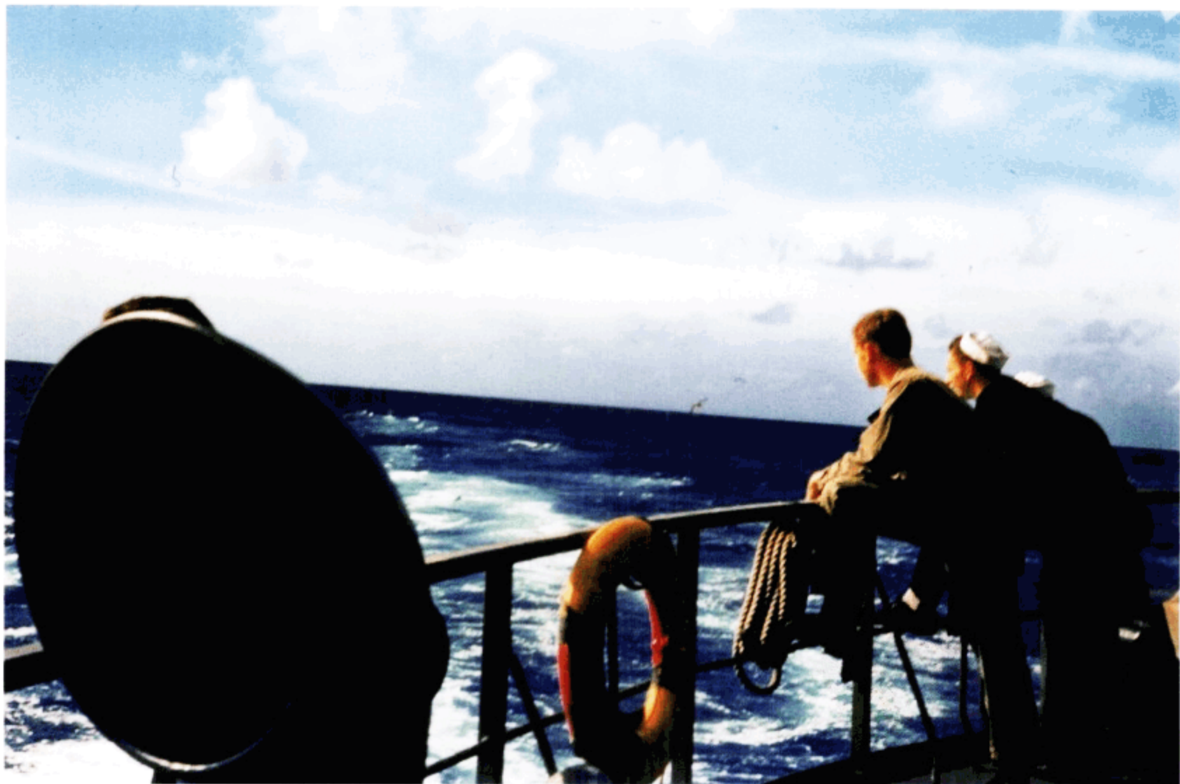
从上海起航横跨太平洋前往美国西雅图途中的镜头