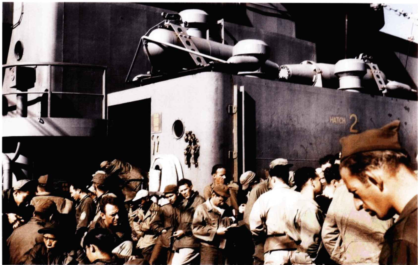
挤满甲板的美国军人