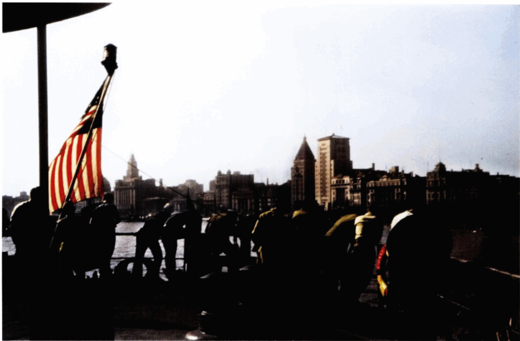
黄浦江上，在甲板上等待军舰起航的美国士兵。