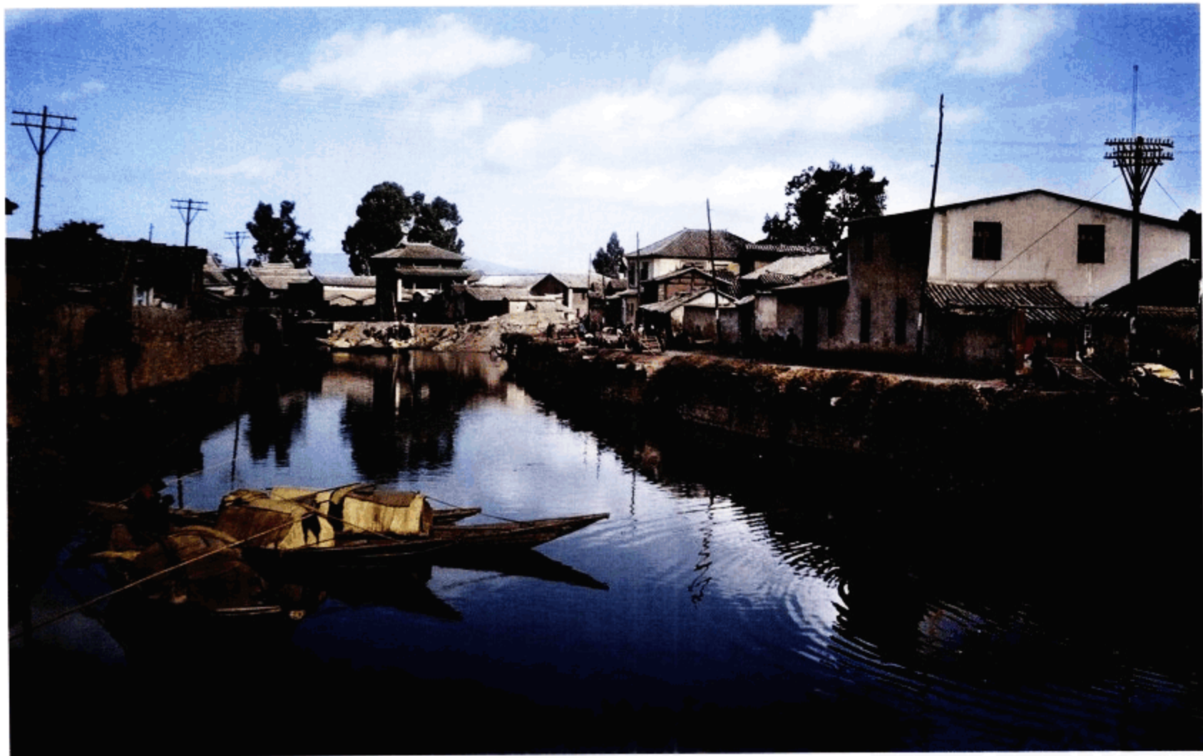
流经民宅的河道