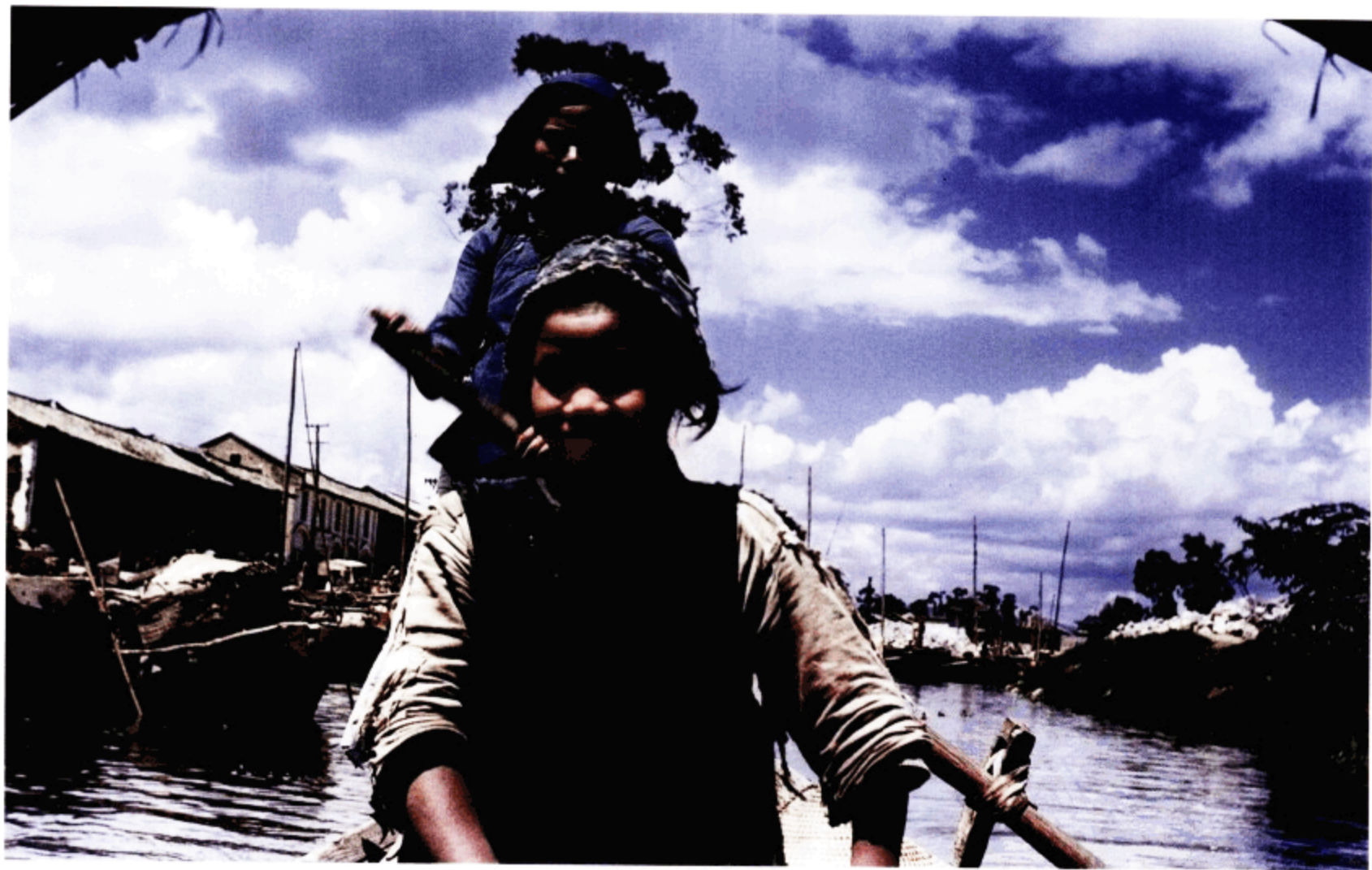
划船的姑娘