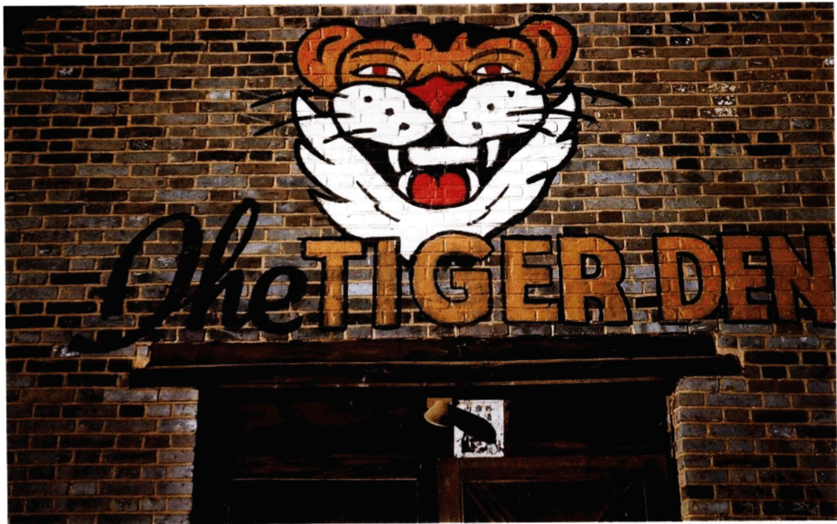
“虎穴”是给住在昆明空军基地三号宿舍的中队成员观看训练影片和电影的地方。