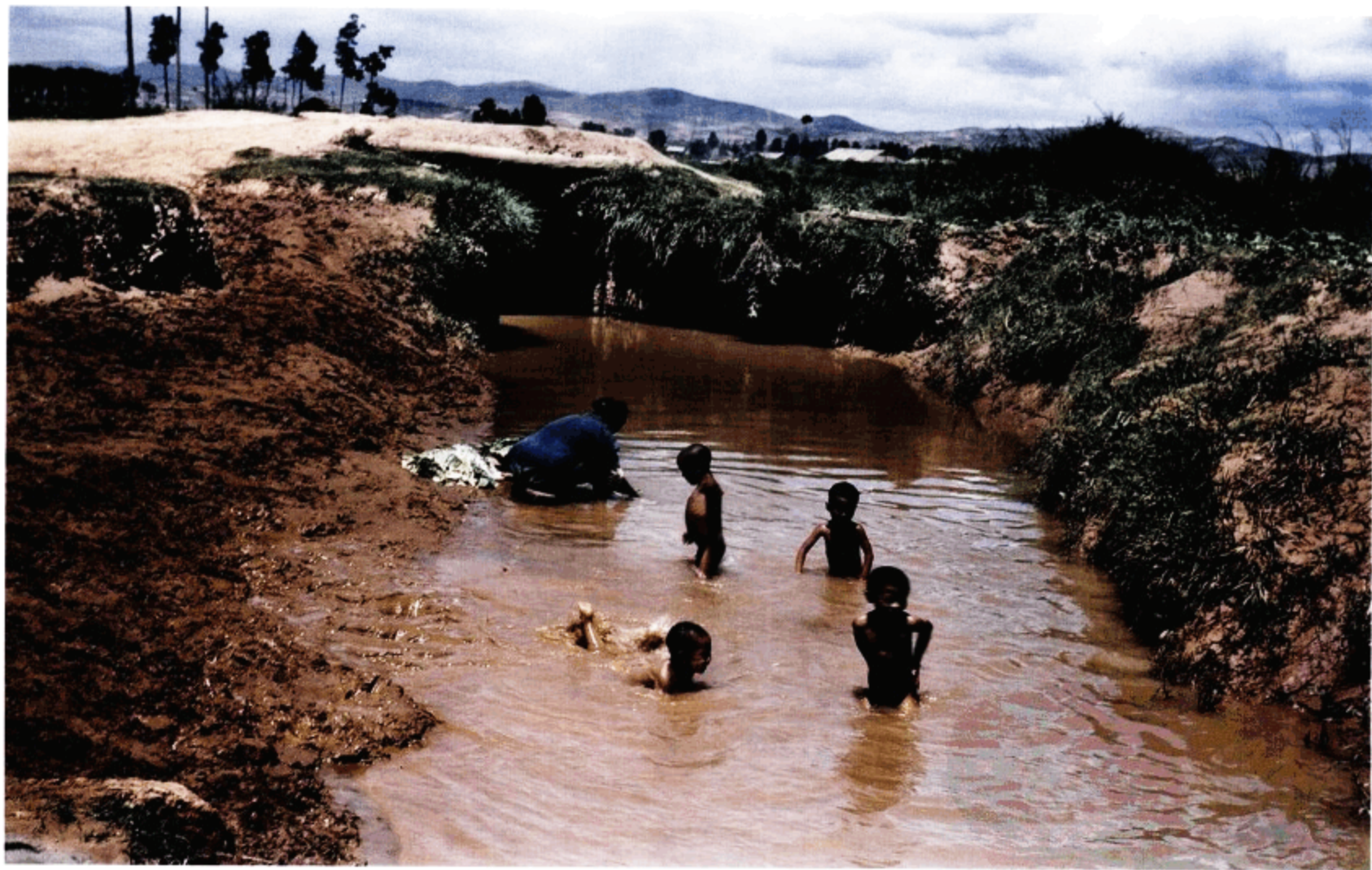
正在戏水的儿童