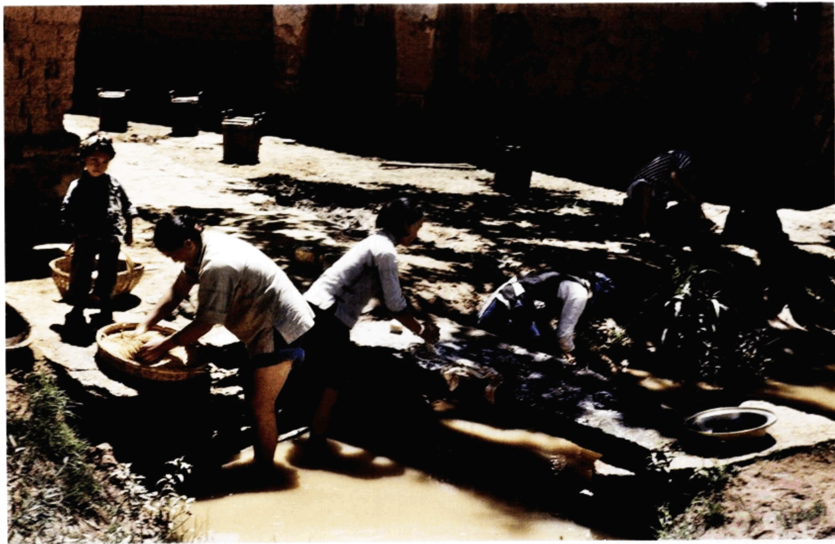
洗衣的妇女