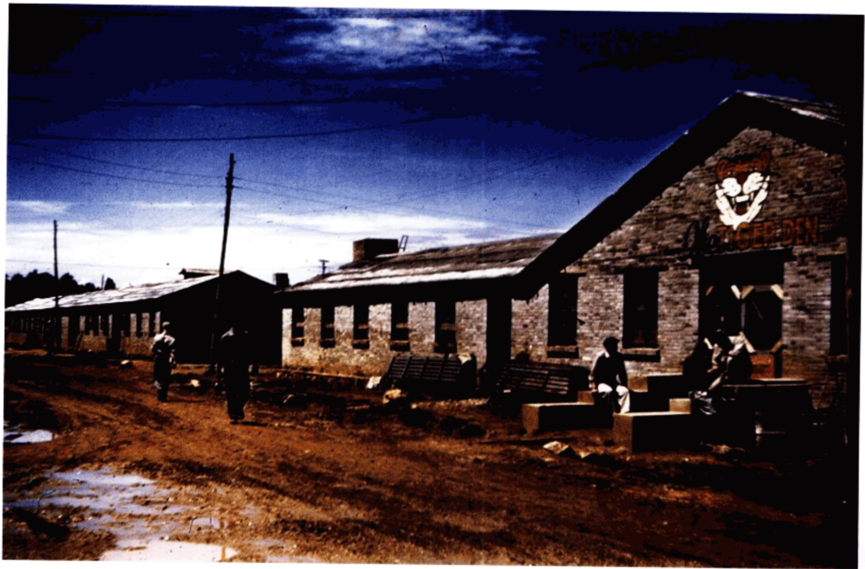
“虎穴”外景（威廉·迪柏 摄）